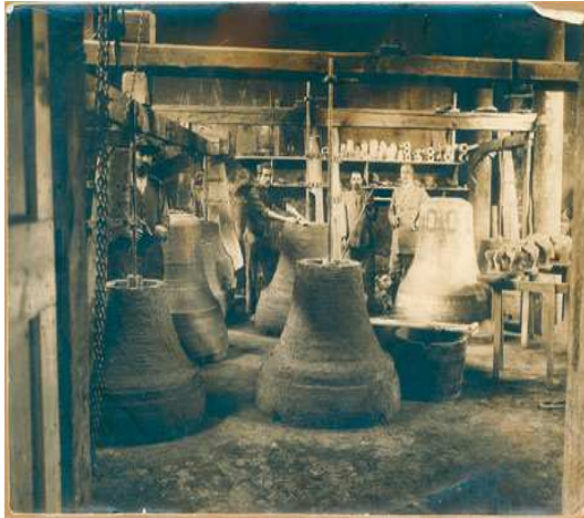
Figura 3: Antigua fundición de Poli.