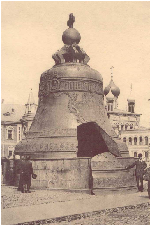
Figura 1: Campana Tzar Kolokol de Moscú.

madera y metal, cuyo perfil es el de la cara interior de la campana y se hace girar alrededor de un eje. De esta forma obtiene un molde con su cara exterior afinada y que se corresponde con lo que será la cara interior de la campana (noyo de la campana), para a continuación cubrirlo con una fina capa de ceniza mezclada en agua y algo de barro (figura 2). El objeto de esta fina capa es evitar que la siguiente que se va a dar, se adhiera al núcleo ya elaborado.