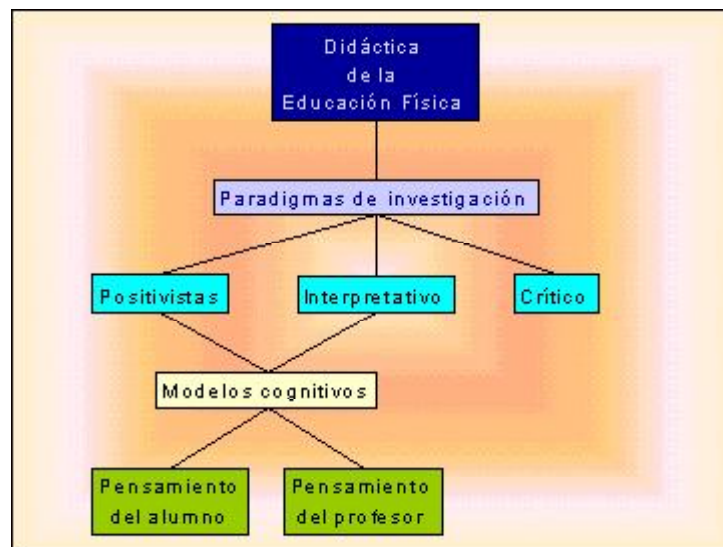
Figura 1: Mapa conceptual

Ahora bien, cada uno de estos paradigmas se ha interesado por algunos aspectos de la enseñanza por lo que su tarea investigadora ha hecho avanzar la Didáctica de la Educación Física como verdadera didáctica específica aportando información sobre el conjunto de la teoría curricular.