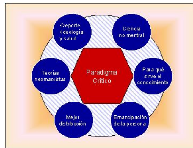
Figura 5: El paradigma crítico

Este paradigma aparece a partir de teorías neomarxistas entre cuyos precursores se pueden citar Freire, Popkewitz, Giroux, Apple, etc. cuyas investigaciones parten de una crítica al estatus establecido a la vez que se orienta a la construcción de una sociedad más justa. En la actualidad, son minoría los investigadores que llevan a cabo estudios desde esta perspectiva en el ámbito de la pedagogía de la Educación Física, no obstante observamos un incremento de estos en los foros más representativos.