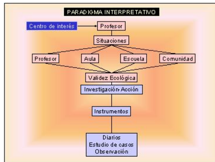
Figura 4: El paradigma interpretativo

El mundo social no puede ser comprendido en términos de relaciones causales debido a que las acciones humanas poseen sig-