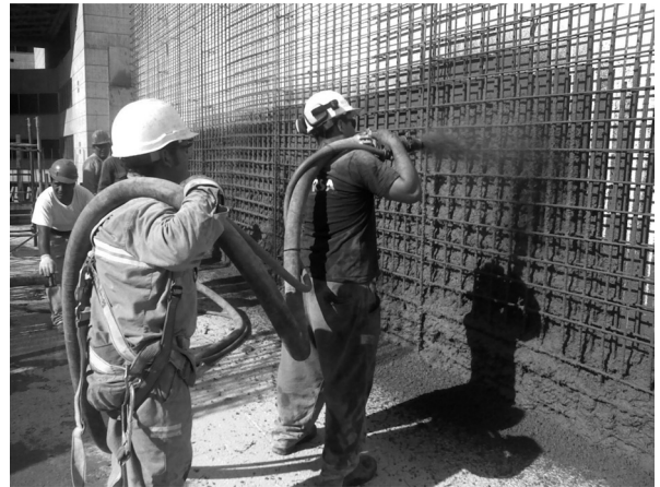
Figura 3. Operario proyectando hormigón en tabique.

posturas forzadas, repetir los movimientos y trabajar con elementos vibrantes aparecen asiduamente en todas las tareas, utilizándose el mismo grupo de músculos por períodos prolongados dando lugar a las lesiones de origen laboral. Esto genera la disminución de la fuerza física, pérdida en la elasticidad de la masa muscular, así como la reducción de la masa ósea y la consiguiente fragilidad en los huesos.