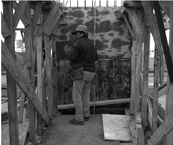
Figura 2. Elevación de materiales (hueco de ascensor) sobre estructura inestable.

la Ciudad de La Plata, se consideran para el análisis de las principales problemáticas, los edificios en altura de viviendas unifamiliares y comerciales, particularmente en el rubro de hormigón armado, destacándose los accidentes más frecuentes: