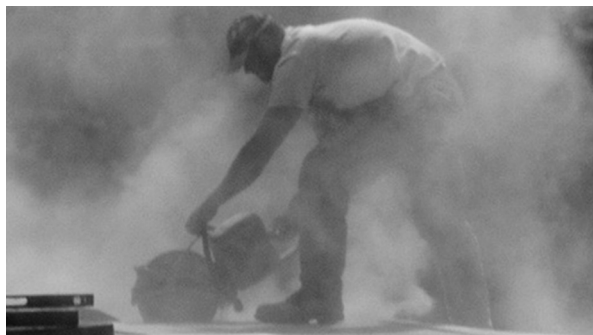
Figura 4. Exposición a la sílice cristalina.

Un número importante de accidentes laborales se produce por una cadena de procedimientos inadecuados donde la tarea, los equipos, el entorno y falta de control, en muchas oportunidades, resultan ineficientes. A partir de estas circunstancias se plantea trabajar la prevención desde la empresa y sus operarios conjuntamente con equipos profesionales.