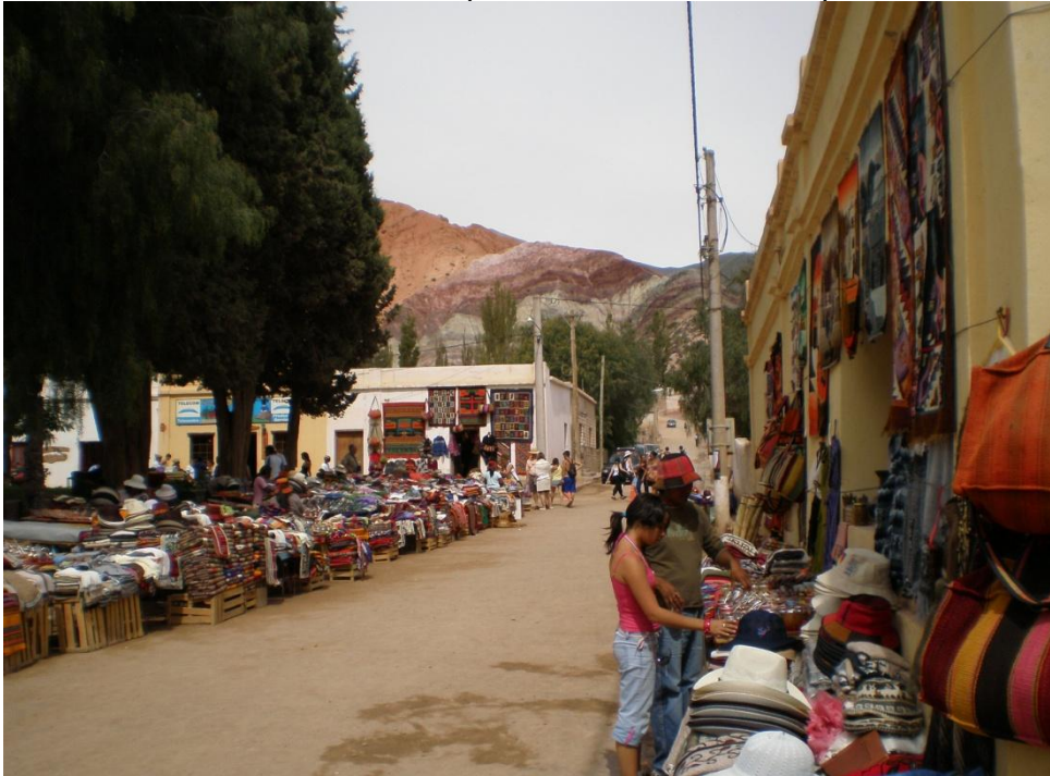
Fig. 1: Quebrada de Humahuaca, el impacto del comercio en la plaza de Purmamarca.