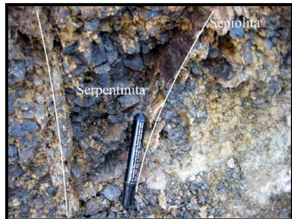
Figura 3. Fracturas rellenas de sepiolita dentro de serpentinitas