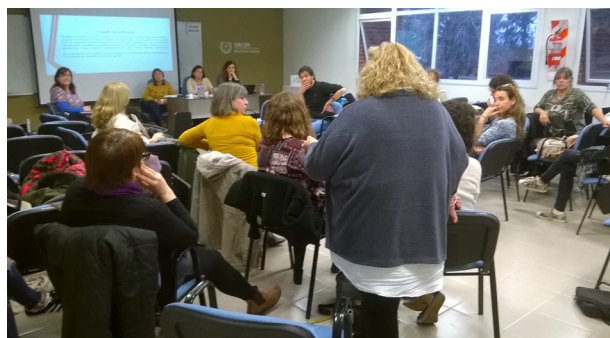
Ateneo interno de investigadores del NEES

Sus investigadores participan activamente en redes académicas, por lo que mantienen vínculos y convenios con centros del país y del exterior, para el desarrollo de actividades de investigación, formación de postgrado y vinculación. Miembros del NEES participan de distintas actividades académicas en la UNCPBA, UBA, UNLP, UNLZ, FLACSO, UNMdP, UNR, UNS de Argentina, y fuera del país en UPF, UFSM, UNICAMP, Universidade de Caxias do Sul (Brasil) y UV (España).