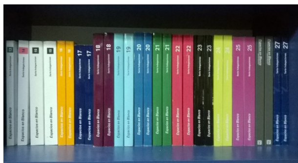
Revista Espacios en Blanco

El NEES edita, desde el año 1994, la Revista Espacios en Blanco, que forma parte del Núcleo Básico de Revistas Científicas Argentinas indexadas del CAICYT-CONICET y LATINDEX, ESCI ( Emerging Sources Citation Index ) de Web of Science , y en los catálogos de Scielo y Redalyc.org.