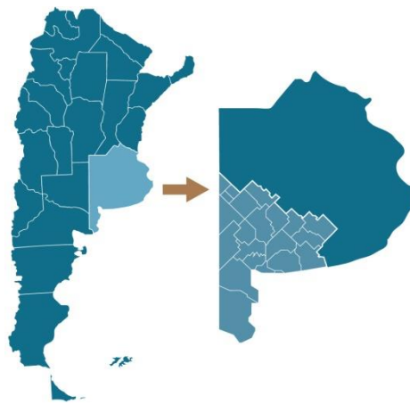
Fig. 1. Localización del área de estudio: Sudoeste Bonaerense. (Elaboración propia)

El Sudoeste Bonaerense (SOB, Figura 1), región de estudio del presente trabajo, no escapa de dicha problemática ya que tiene como principal actividad económica la producción agropecuaria, que genera permanentemente envases vacíos de fitosanitarios, siendo ésta una problemática que sólo se ha tratado de manera aislada y poco eficiente en los distintos municipios.