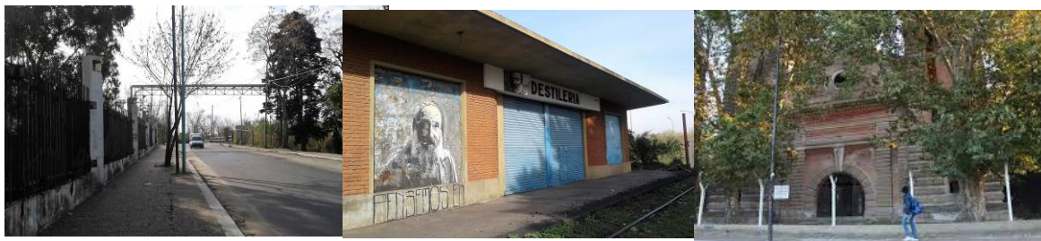
Figura 13: Entorno del PUH conjunto de Usina.

En la actualidad la Usina en su conjunto se mantiene en pie, sin embargo su estado de conservación se halla con gran deterioro, faltantes de piezas, daños por falta de mantenimiento y patologías que agravan su situación, tales como corrosión en materiales ferrosos, fisuras y desprendimiento de materiales por intrusión y colonización de microorganismos biológicos (líquenes, hongos) (figura 13).