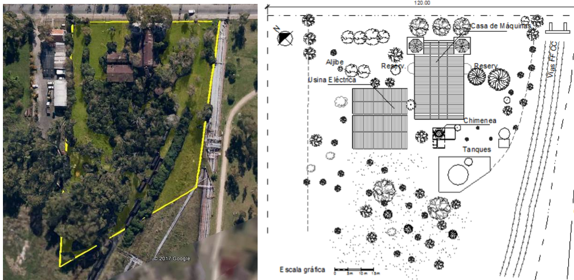
Figura 12: Conjunto Usina Hidráulica [10].

Asimismo el conjunto de la usina se complementa con los componentes mencionados en la figura xx, las vías del ferrocarril que actualmente derivan cargas del puerto a la estación La Plata Cargas, los canales y los barrios, configurando un paisaje urbano, industrial, con la superposición de huellas de la historia entre lo natural y lo antrópico.