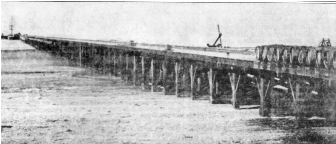
Figura 2: Muelle de Punta Lara con ramal ferroviario instalado por Wheelwright en 1872. "Se observan los barriles de tasajo sobre el muelle, junto a las vías que se utilizaban para su transporte" [6]

A la altura de la estación Punta Lara, ese ramal se bifurcaba hacia un muelle que tenía por objeto presentar al tráfico un servicio inmediato, mientras se llevan a cabo los trabajos del puerto de la Ensenada, y la carga y descarga del cargamento de los barcos "en los carros del ferrocarril, que los conducirá a la capital, en dos o tres horas, y a un precio de dos patacones más o menos por tonelada, es decir, la mitad de costo presente en las lanchas cubiertas" . Entre las actividades que se desarrollaban en las instalaciones portuarias, se encontraba la exportación de tasajo, ó productos de ganadería elaborados en los saladeros de Cambaceres y de Berisso que "eran colocados en toneles, a la espera de los barcos que llegaban a buscarlos, así también como frutos y hortalizas de huertas de la zona, y lo derivado de la actividad pesquera" [5] (Figura 2)