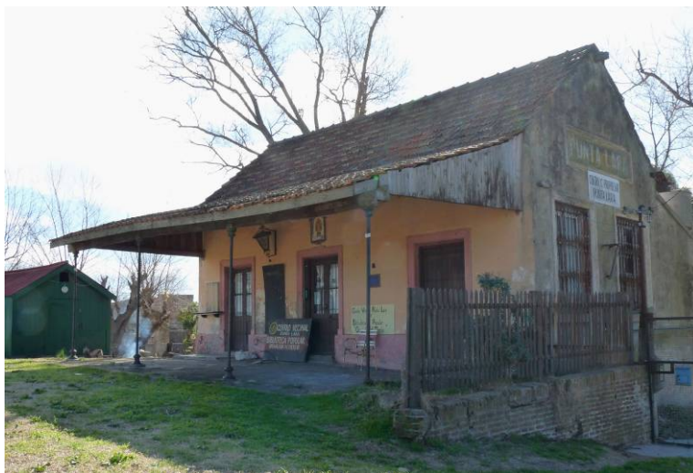
Figura 9: Antigua estación ferroviaria de 1872.

El área "Centro Cívico" Punta Lara que fuera germen del originario pueblo, contiene en su morfología urbana significativos atributos paisajísticos singulares, dados por la armoniosa convivencia entre los elementos naturales autóctonos y los construidos. Los primeros pueden definirse con río de La Plata y el arroyo la Guardia (canal Villa Elisa), la flora y fauna autóctona característica de la región presente en los amplios espacios verdes de esparcimiento sobre la costa; mientras que los construidos, con instalaciones que datan de la primera formación del pueblo en el siglo XIX, como es la estación de ferrocarril, actualmente "centro vecinal y biblioteca popular"; en convivencia con importantes exponentes de la arquitectura moderna tales como el complejo balneario del ex Jockey, declarado en el 2011 "conjunto patrimonial histórico arquitectónico y paisajístico de la Provincia de Buenos Aires, por ser unos de los de los edificios más emblemáticos e históricos del lugar" y el conjunto de edificios de orden cívico en las proximidades. Esas características, entre otras, nos permiten re-identificar el presente sitio como un "Paisaje Urbano Histórico".