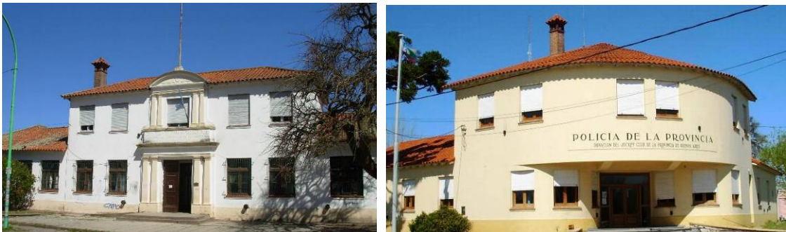
Figura 7: Escuela y colonia de Vacaciones y Destacamento de Policía de la Provincia. Se destaca en la fachada de ambos edificios el bajo relieve que lleva el nombre del edificio y debajo la insignia "donación del Jockey Club de la Provincia de Buenos Aires".