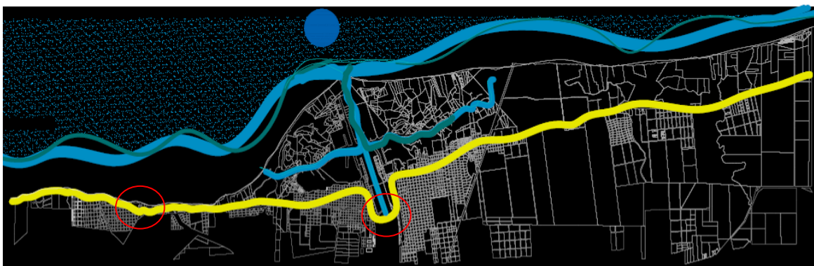
Figura 1: Borde Costero Región Capital: PUH (1) Centro Cívico Punta Lara y PUH (2) Puerto y Usina Hidráulica.

Los casos que se presentan justifican en el concepto de re-identificación de PUH en los que el “Centro Cívico Punta Lara”, y la “Usina Hidráulica” configuran parte del frente fluvial portuario, destacando características singulares (figura 1).