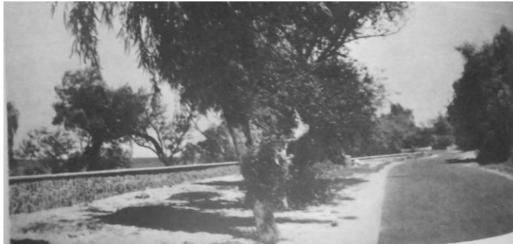
Figura 8: Camino costanera y muro de contención [9]

frente al estrictamente vial y económico", por servir principalmente a dicho uso turístico [9].