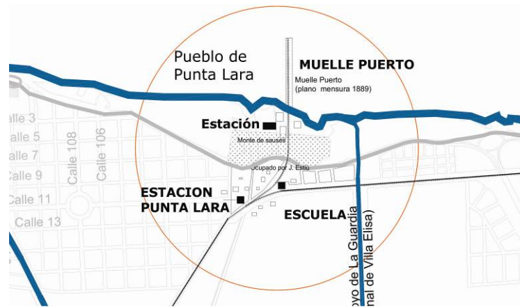
Figura 3: Primer asentamiento poblacional en torno a la estación del ferrocarril y el muelle puerto. Elaboración propia.