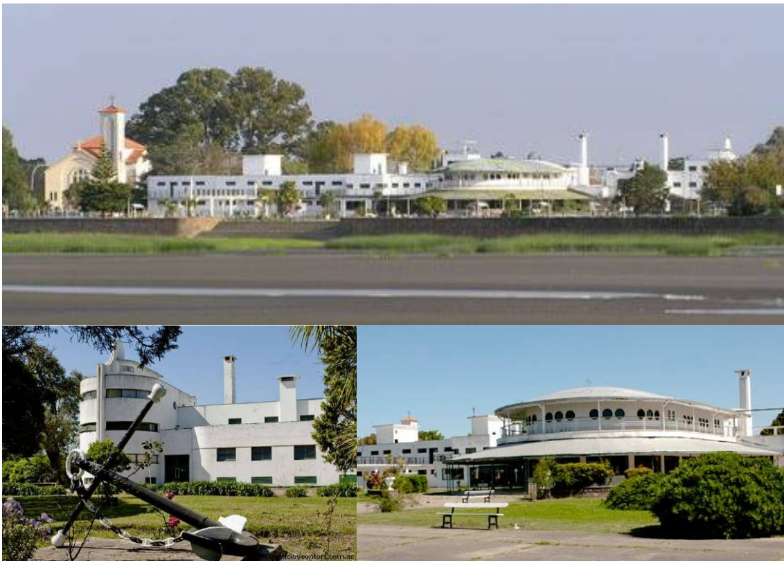
Figura 5: Vista del complejo náutico desde el río de La Plata y edificios principales

Entre los elementos del sector se destaca el complejo del ex Jockey Club, proyectado en 1935 por el Arq. Luis M. Pico Estrada, bajo la presidencia del Doctor Uberto Vignart (1934-1953), siendo reformulado y ampliado hacia 1940 por el Ing. Julio A. Barrios. Su tipología puede enmarcarse en el estilo de Arquitectura Moderna recreativa de los años 30. El complejo representaba “uno de los más modernos balnearios en cuanto a su finalidad, solo comparable a los de igual categoría de las costas del Mediterráneo y el lago Geneve en Suiza [...] debería titularse Hotel de veraneo a orillas del mar, pues su destino, además de las otras actividades de carácter mundano y deportivo, es el de hospedar a los socios y las familias de los mismos con todas las comodidades y confort, inherentes a un hotel” [8].