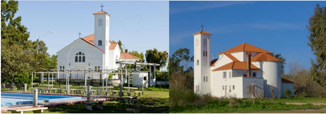
Figura 6: Capilla Stella Maris