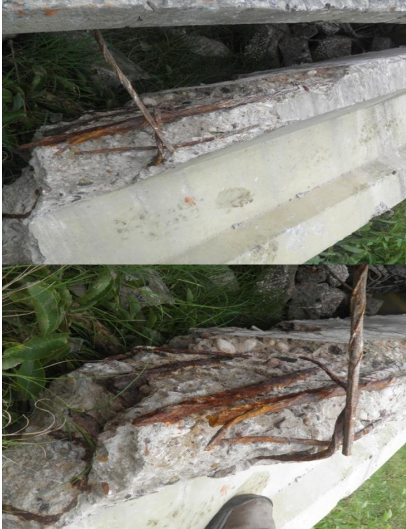
Figuras N°6 y N°7: Vista ménsula y zona de ruptura. Vista en detalle de la zona de ruptura y estado de corrosión sobre armaduras principales.

En las fotografías que se exponen a continuación se puede observar algunos detalles de los restos del siniestro.