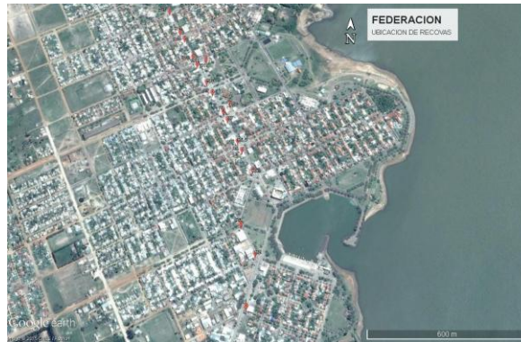
Figura N°1: Esquema aéreo de la ciudad donde se destacan su avenida principal y los sectores de interés para el relevamiento de las recovas.

Se presenta, además, una conclusión respecto al mecanismo de falla que produjo el colapso en una sección localizada de la recova más afectada, a partir del cual surge todo este análisis.