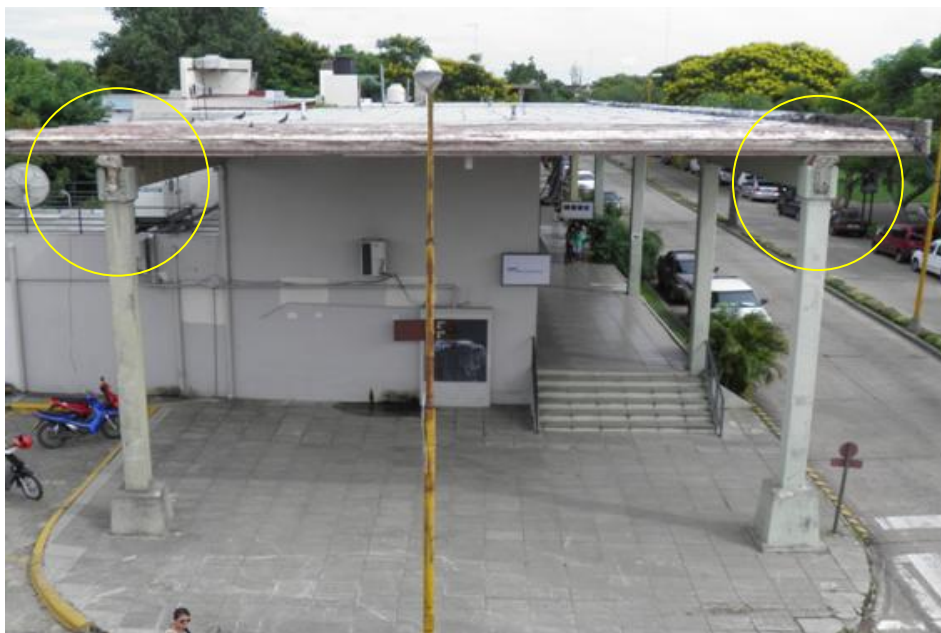
Figura N°2: Vista general de la sección de colapso.

Construidas hace aproximadamente treinta y cinco años, presentan un estado de conservación variado. Algunos sectores localizados se perciben en buen estado, y en otros, se observan los efectos de una ausencia total de mantenimiento en toda su vida útil. En cuanto a la estructura siniestrada, se observa que el colapso se ha producido en su sección en voladizo. La superficie semicubierta presenta cortes en sus vigas de soporte y serias afectaciones por corrosión.