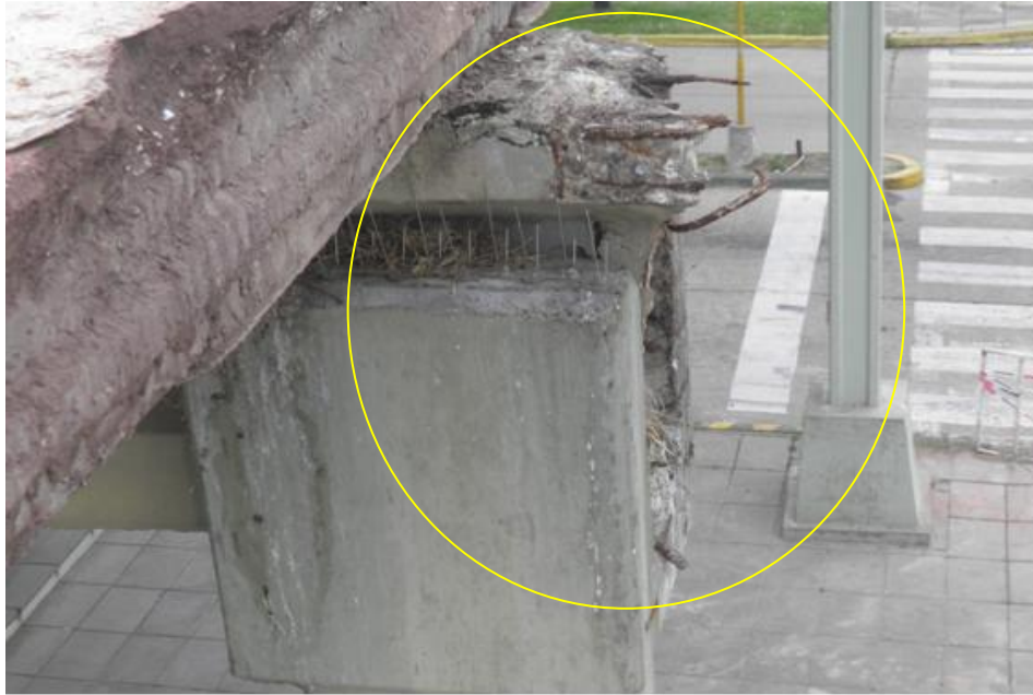
Figura N°3: Vista en detalle de la sección siniestrada.