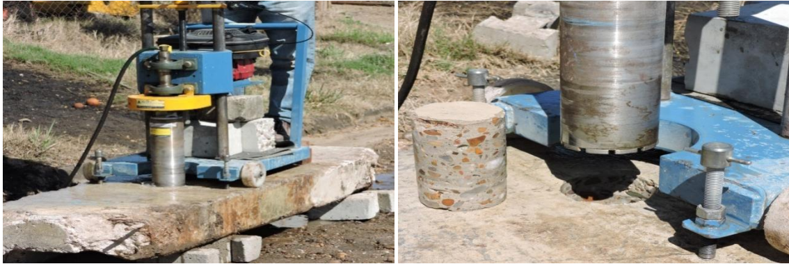
Figuras N°8 y N°9: Vista equipo extractor de testigos, sobre ménsula colapsada. Vista del testigo extraído.