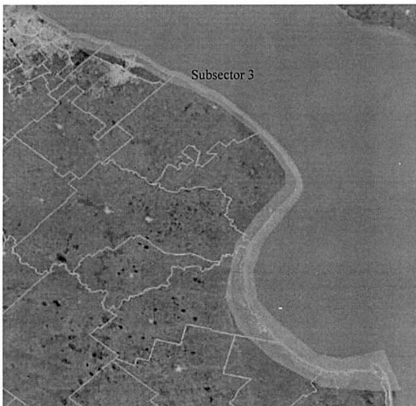
Imagen 3. Subsector 3: Tramo Avellaneda - Pta. Rasa