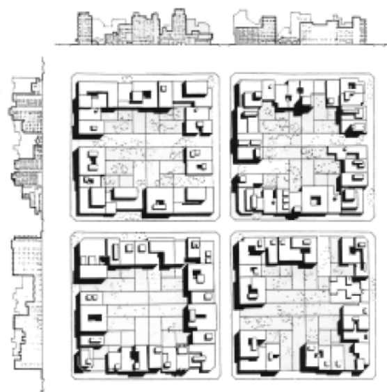
Figura 2a) Prefiguración de la imagen urbana. Áreas residenciales, según proyecto de decreto Normas Básicas para la Zonificación Preventiva del Área Operativa I. Ministerio de Obras y Servicios Públicos. Provincia de Buenos Aires. Dirección de Ordenamiento Urbano. 1971.

Las teorías, principios y valores del modelo urbano sustentado por las normas básicas fue-