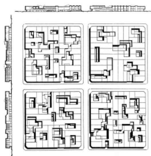
Figura 2 b) Prefiguración de la imagen urbana. Áreas centrales, según proyecto de decreto Normas Básicas para la Zonificación Preventiva del Área Operativa I. Ministerio de Obras y Servicios Públicos. Provincia de Buenos Aires. Dirección de Ordenamiento Urbano. 1971.