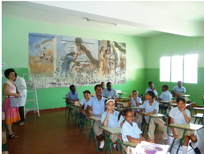
Fotografía 1. Los murales se encuentran dentro de las aulas, lo cual los expone a daños y dificulta su acceso para conservarlos.

Actualmente los murales se encuentran en mal estado de conservación debido a décadas de abandono, deterioro y daños. Por su carácter único dentro de una edificación escolar emblemática de su época, y por su valor artístico, histórico y social, este patrimonio merece ser preservado.