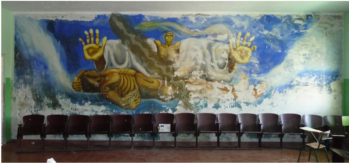
Fotografía 4. "Alegoría a la extinción de la raza indígena". Mural del Salón de Actos, que presenta los problemas de los demás, propuesto para realizar proyecto piloto de conservación.