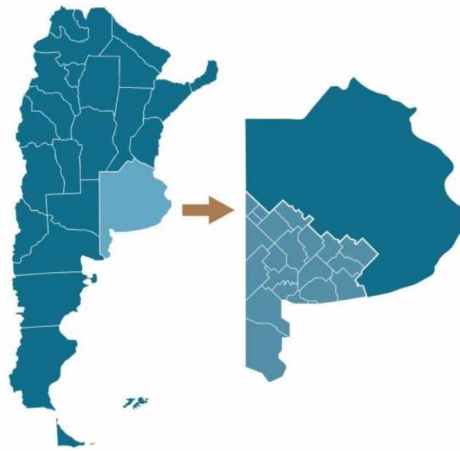
Fig. 1. Localización del área de estudio: Sudoeste Bonaerense. (Elaboración propia)

El Sudoeste Bonaerense (SOB, Figura 1), región de estudio del presente trabajo, no escapa de dicha problemática ya que tiene como principal actividad económica la producción agropecuaria, que genera permanentemente envases vacíos de fitosanitarios, siendo ésta una problemática que sólo se ha tratado de manera aislada y poco eficiente en los distintos municipios.