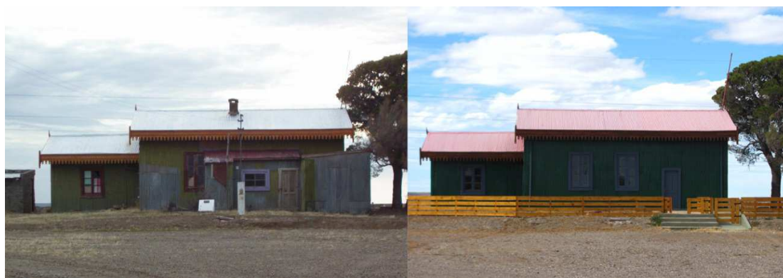
Figura 2: Vista de la estación de ferrocarril de Jaramillo antes (foto del 22 de enero de 2003) y luego de la restauración (foto del 6 de febrero de 2011).