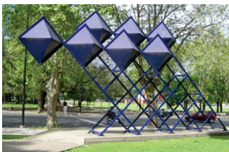
Monumento al Líbano. La Plata

En la ciudad de La Plata se ha relevado y analizado el estado de conservación de distintos monumentos. Se ha verificado, en algunos casos, como en el "Monumento al Líbano" (Avenida 1, esquina 53), que presenta un grado de corrosión avanzado que compromete su estabilidad. Otras esculturas como las que se encuentran en Plaza Moreno "Las cuatros Estaciones" y el "Arquero", presentan una corrosión superficial, siendo que la pátina muestra signos de envejecimiento atribuibles al intemperismo y a su vida útil. Además, en el Cementerio Local se realizaron actividades de extensión que consistieron en la restauración de algunas de las bóvedas y una evaluación y ordenamiento de los expedientes de las obras de la zona de bóvedas desde la época fundacional.