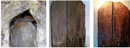
Lápida de Madera, antes y luego del tratamiento de restauración. Cementerio de Algarrobo

En el partido de Pehuajó, en su ciudad cabecera, se relevó entre otros, el edificio de la Sociedad Española de Socorros Mutuos, en el cual se analizaron las patologías que presentaba particularmente vinculadas a procesos de circulación de agua. También se estudiaron los ornamentos determinándose que el sustrato corresponde a Sulfato de Calcio \text{CaSO}_4 (yeso) mientras que los dorados que presentan algunos de los ornamentos están conformados por un ligante que se analizó mediante Espectrometría Infrarroja con Transformada de Fourier (FTIR); en el espectro obtenido, se aprecia la presencia de sustancias caracterizadas por su naturaleza como una proteína , y otra, cuya característica espectroscópica principal es la presencia de grupo carbonilo, que debe corresponder al barniz oleoresinoso , recubrimiento original de resina y aceite secante; y después, otro añadido de tipo proteico; mientras que el pigmento dorado utilizado corresponde a un pigmento inorgánico formado por una mezcla de Cobre y Cinc, surge entonces que se trata de una pintura dorada y no de láminas de oro. El mortero de revestimiento de los palcos está integrado por una arena natural subfeldespática (65 %), la absorción en inmersión de agua a 24 hs y el peso específico del mortero, son del orden de 9,8 % y de 2,10 % respectivamente. Estos valores estarían indicando que el mortero ha sido elaborado con un cemento portland.