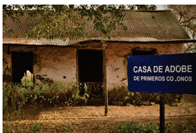
Casa de Adobe. Paraje Algarrobo, C. Casares