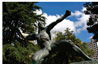
Monumento al Arquero. La Plata