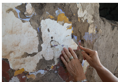
Casa de Adobe. Toma de muestras de pinturas

En el cementerio de Algarrobo, se observó particularmente el avance de las tecnologías constructivas y el empleo de los materiales, desde la madera en las lápidas, los ladrillos cerámicos y las rocas ornamentales (mármoles y granitos) en las bóvedas, etc. De una de las tumbas se obtuvo una lápida de madera muy deteriorada que fue analizada y restaurada en el LEMIT; se identificó como Quebracho Blanco ( Aspidosperma quebracho blanco ) cuyo posible lugar de procedencia sería la región Chaqueña de Argentina, casi con seguridad obtenida durante la obra del ferrocarril. En cuanto a la protección y conservación, luego de estacionada se aplicó un tratamiento tipo lasur . Como resultado principal se observó la rehidratación, generando un aspecto estético mejorado y la aparición del color natural de la madera, así como también, el sellado de las grietas y microfisuras. La lápida restaurada fue entregada al Museo Histórico de Carlos Casares.