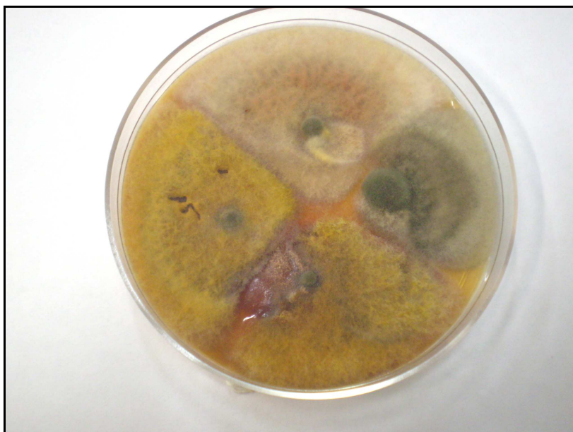
Fig. 5: Cultivos de hongos realizados en laboratorio

Aspergillus niger : micelio incoloro, con conidióforos erguidos y extremos ensanchados en una cabezuela donde se desarrollan fiálides de las cuales brotan conidios unicelulares oscuros, de paredes espinosas.