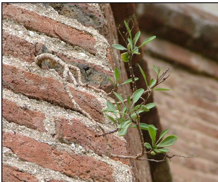
Fig.4: Nicotiana glauca (Palán-palán)

Nicotiana glauca (palán-palán) (Fig. 4): arbusto de gran porte, que se reproduce por vástagos, con flores amarillas tubulares, típica de zonas montañosas y crece sobre rocas. Se adapta al hábitat urbano creciendo en muros y cornisas.