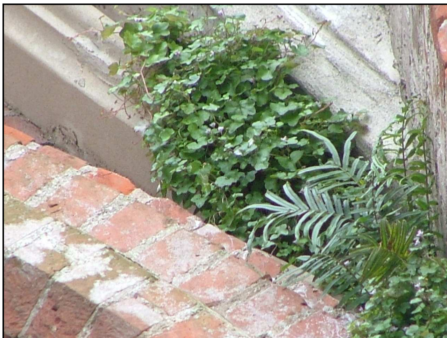
Fig. 3 : Pteris longifolia (helecho) y Cymbalaria muralis (Besitos porteños)

Adiantum raddianum (Culantrillo): helecho con fronde dividida en tres pinnas, con forma de abanico, y el raquis de color negro brillante. Es muy común en muros, en sitios sombríos y húmedos.