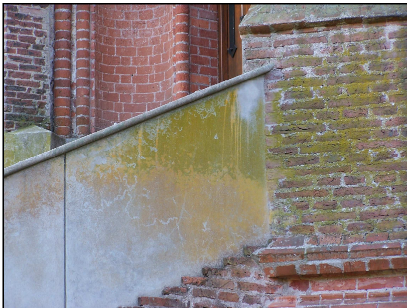
Fig. 2: Pared colonizada por Caloplaca austroclitina