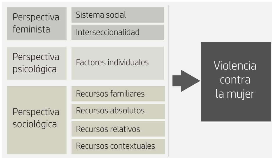
Figura 1. Perspectivas teóricas sobre violencia contra la mujer. Fuente: Elaboración propia.

refiere a parejas heterosexuales). Además, dada la existencia de valores perdidos en las variables principales, la muestra utilizada en los análisis fue de 772 mujeres. La técnica principal empleada es la regresión logística.