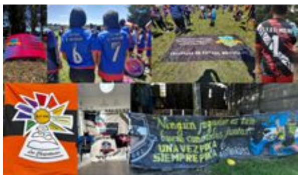
Figura 4. Collage LBF: banderas, camisetas, murales expresión de metas y objetivos

considerando el juicio crítico y solidario en la práctica de niños y jóvenes, abandonando la divulgada idea de la indiferencia y la apatía que hoy se les atribuye y reconociendo los diversos modos en que lo público es problematizado por ellos, en contextos socioinstitucionales que los preceden y dentro de los cuales necesariamente, deberán discutir para cambiar (p. 21).