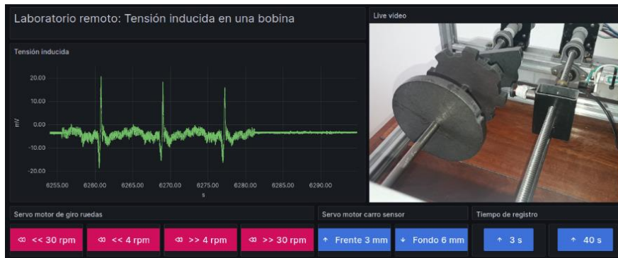
FIGURA 2. Vista general de la interfaz de usuario.