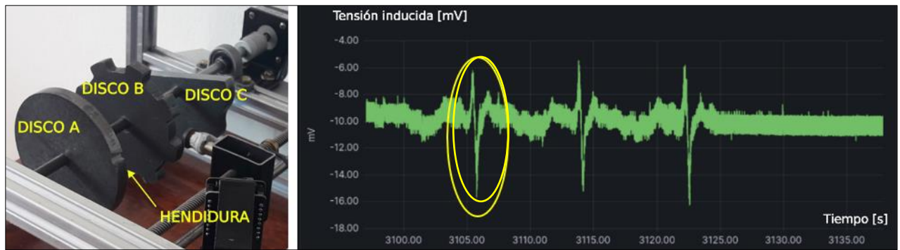
FIGURA 4. A la izquierda, disposición de los discos del experimento. A la derecha, señal de salida del sensor durante un registro completo para el caso de estar ubicado en frente de la cara lateral del disco A.

Debido que el material del disco es ferroso (acero A36) y suponiendo que inicialmente no está magnetizado, se asume que la magnetización neta del material tiende a cero en todas las regiones del disco que no estén próximas al sensor (figura 5, flechas azules).