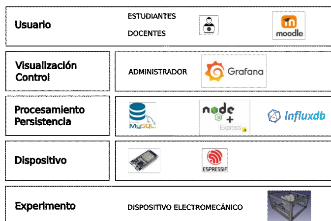
FIGURA 3. Esquema general de la arquitectura del LR.