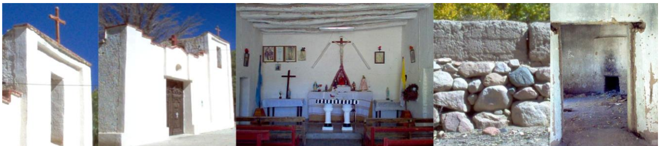
Figura 2 – Colanguil, Capilla de San Isidro Labrador - Antigua Construcción (1750)

Este conjunto edilicio, necesita intervenciones para asimilar a los visitantes sin que sean afectados en su integridad. Por lo que se propone una consolidación estructural a los edificios, ruinas y mejoramiento del entorno.