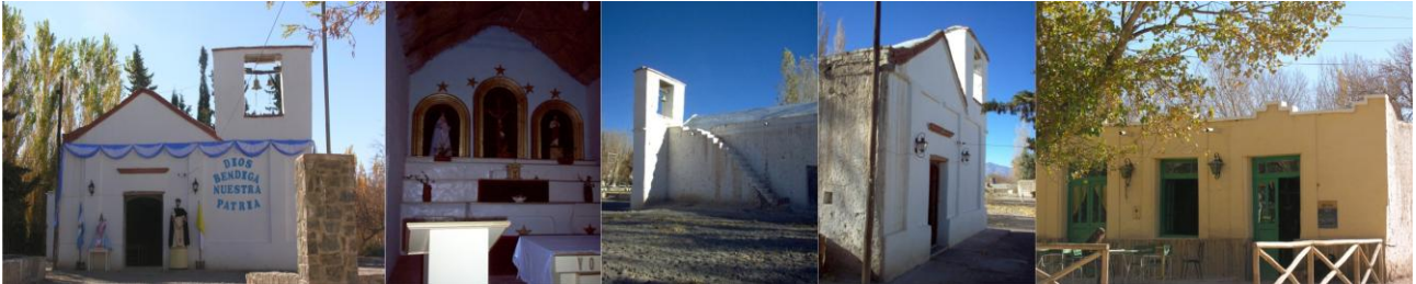
Figura 5 – Rodeo, Capilla Santo Domingo de Guzmán - Casona

Se visita la capilla ubicada en el centro de la localidad, donde se venera a Santo Domingo de Guzmán. Tiene una rica historia en lo que se refiere al edificio, imaginería y devoción. Como la mayoría de las capillas ha sido construida con sistemas constructivos tradicionales y con materiales extraídos directamente de la naturaleza. Posee muros de adobe, los techos tienen pendientes a dos aguas, de madera, con enramada, y palos atados con tientos de cuero, cubierta de torta de barro, revoque grueso de barro.. En el recorrido por la calle principal de nombre Santo Domingo se pueden apreciar casonas antiguas remodeladas algunas para comercio, restaurante y otros.