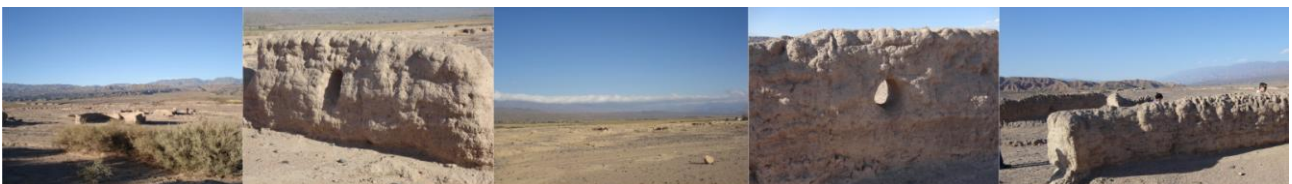
Figura 1 – Angualasto, Ruinas arqueológicas

La instalación humana de Punta de Barro estaba situada al norte del barreal de Angualasto, al pie de la cadena de lomas que separan el piedemonte, bajo el piedemonte medio, ubicada en una loma en la cercanía de una vertiente que por su poco caudal necesitaba ser represada para regar los sembrados, a través de acequias y canales de los que quedan rastros. Esta población estaba situada a 1.800m de altura y se encuentra protegida de los vientos del oeste por las lomas. La ruinas se encuentran sin ninguna protección y expuestas a ser dañadas, para transformarse en museo de sitio y ser un recurso turístico urge ser trabajadas para su conservación. Angualasto es un poblado con disposición aterrazada posee hermosas vistas y sus pobladores alternan trabajos agrícolas con las labores artesanales, elaboración de vino patero, cerámica, trenzado de cuero y tejido al telar.