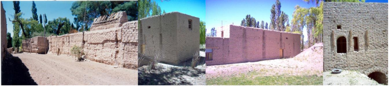
Figura 6 – Villa Iglesia y Bella Vista, Tapias - Molinos