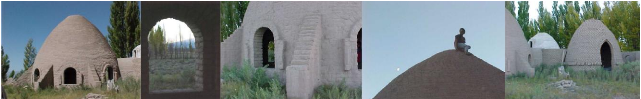
Figura 7 – Guañizuil, Trulys

En este sitio se visitan los trulys, construcciones que responden a los principios de la ecoarquitectura, son de adobe con base circular y techo abovedado, el peso de la cúpula hace que los muros se estabilicen por medio de contrafuertes. La unión entre el encadenado y la cúpula así como entre el muro y el encadenado debe ser muy estable para transmitir las fuerzas horizontales del sismo. Se conocen científicamente porque es un tema estudiado y analizado por el Arq. Gernot Minke. Si bien no son característicos del lugar tienen un estilo y tecnología apreciables para el visitante.