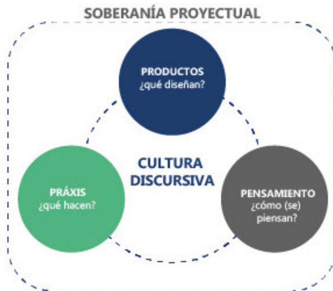
Figura 3. Cultura discursiva y soberanía proyectual. Esquema gráfico que involucra las unidades de análisis propias del Diseño Industrial.

La noción de cultura discursiva sintetizada en la [Figura 3], emerge como un aporte significativo para superar la grieta empresario-diseñador. Lejos de ser un impedimento, la fuerte identidad proyectual de los egresados de la FdA-UNLP se convierte en el sustrato para construir emprendimientos con un ethos distintivo. Esto cuestiona los postulados que ven en la formación en diseño una mera barrera para la gestión, proponiendo que esta formación es la base de una soberanía proyectual que permite negociar la autonomía creativa frente a las lógicas mercantiles. El rechazo a la escalabilidad ilimitada y la estrategia del vamos viendo pueden interpretarse, entonces, no como fallas de gestión, sino como actos políticos de reivindicación disciplinar, en sintonía con lo que Richard Buchanan (1992) denominaba el diseño como «forma de acción».