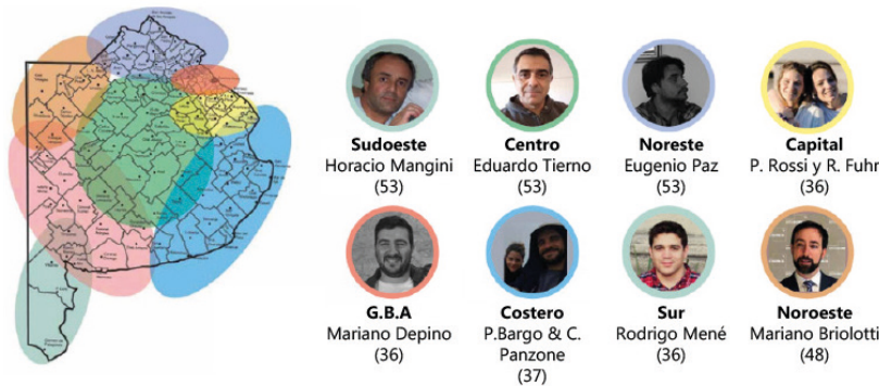
Figura 2. Casos de estudio de acuerdo con el criterio de regionalización que establece ocho subespacios dentro de la provincia de Buenos Aires

La selección de los casos de estudio detallados en la [Figura 2] siguió criterios específicos: iniciativas vigentes con al menos tres años de actividad, originadas entre 2009-2019, lideradas por egresados de la UNLP y localizadas dentro del EEB según la regionalización de Erbes y Girandola (2019). Se buscó una diversidad que no se limitara a la puesta en marcha de empresas tradicionales. Los ocho casos analizados —desde la metalúrgica familiar adaptada (Metalúrgica Mangini) hasta el estudio experimental con biomateriales (Dip Estudio) y el intraemprendimiento (Bemol Industrial)— reflejan esta heterogeneidad. El análisis de los datos se realizó mediante codificación temática, reconstruyendo las trayectorias y extrayendo los núcleos significativos de la cultura discursiva identificada.