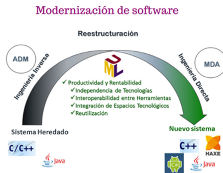
Figura 2. Esquemas de modernización de software partiendo de metodologías ADM hasta esquemas actuales de metamodelado

por ejemplo, con tecnologías orientadas a objetos. Nuevos enfoques de desarrollo de software enmarcados en lo que se referencia como MDD (Model Driven Development) podrían dar respuesta a esta demanda, sin embargo, no están lo suficientemente difundidos en nuestro medio que en general opta por nuevos desarrollos que conllevan un alto riesgo y no son rentables. Se propone en esta investigación una integración de ADM con técnicas clásicas de ingeniería inversa de análisis estático y dinámico, con técnicas rigurosas de metamodelado para controlar la evolución de software hacia nuevas o actuales tecnologías.