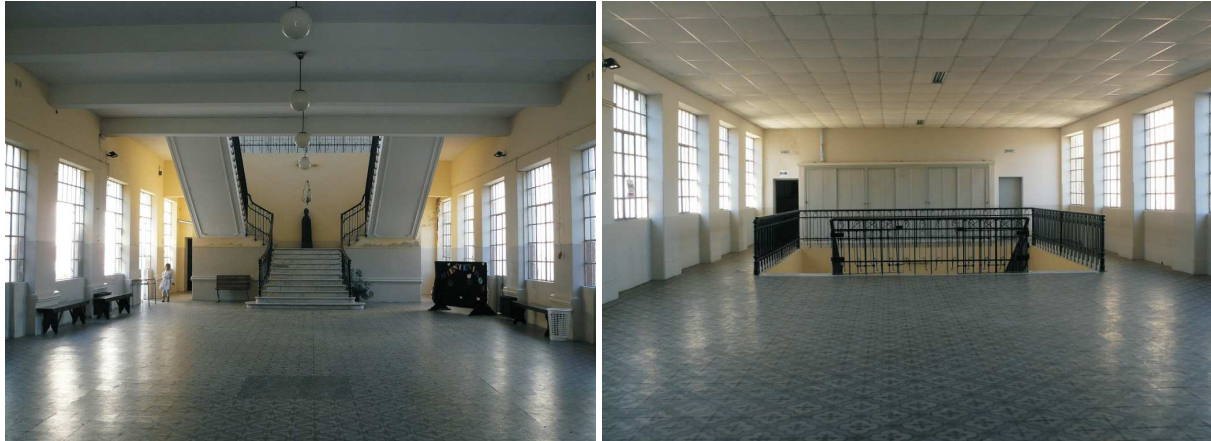
Figuras 6 y 7: Patio interno (SUM) en planta baja y salón principal en planta alta.