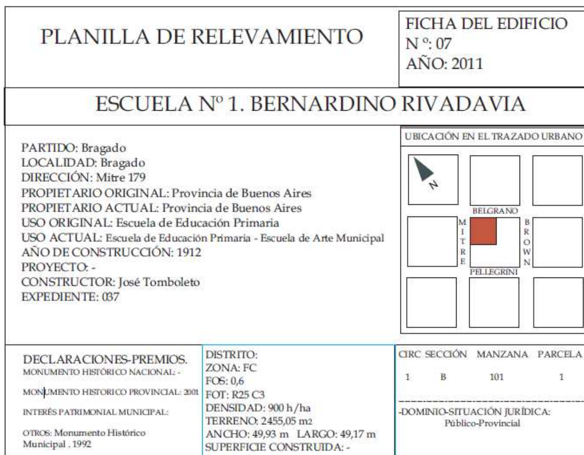
Figura 1: Fragmento de la planilla de relevamiento del Catálogo, con los principales datos del edificio intervenido.

Hasta la actualidad el edificio funciona como establecimiento educativo en la planta baja y desde 2010 funciona en la planta alta la Escuela Municipal de Artes y la Dirección de Deportes.