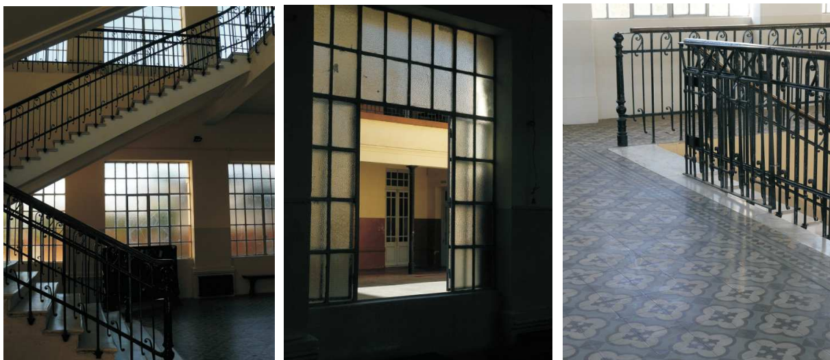
Figuras 8, 9 y 10: Ventanales en torno al patio interno (SUM) y salón principal de planta alta.