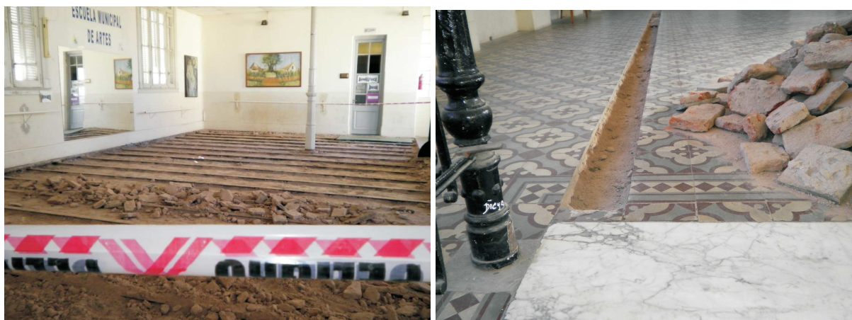
Figuras 11 y 12: piso de la planta alta removido.