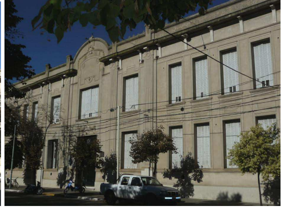
Figuras 2 y 3: Fachadas de la Escuela N°1 de Bragado.

El edificio se desarrolla en dos plantas (fig.4 y 5). El hall de acceso conduce a las dependencias administrativas, patios y aulas y desemboca en el salón de usos múltiples (SUM), que originalmente fue un patio techado (fig.6). Los laterales de este salón fueron cerrados por puertas y ventanas de vidrio repartido, dándole gran luminosidad al ambiente (fig.8, 9 y 10). Además, hay dos patios al aire libre, uno de los cuales presenta una galería con columnas de hierro y pisos de mosaicos, que rodea las aulas de planta baja. A la planta alta se accede por una majestuosa escalera imperial realizada en mármol blanco, con baranda de hierro forjado y pasamanos de madera. Esta escalera conduce a un salón -de similares características y dimensiones que el de planta baja- y a las aulas (fig.7). Los pisos son de mosaico calcáreo de cuidado diseño y los de las aulas son de pino tea machihembrada. Las aberturas de las dos plantas poseen carpintería de madera y postigos de metal. La puerta principal es de dos hojas de hierro forjado.