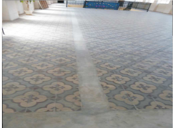
Figuras 13 y 14: piso de la planta alta reconstruido.