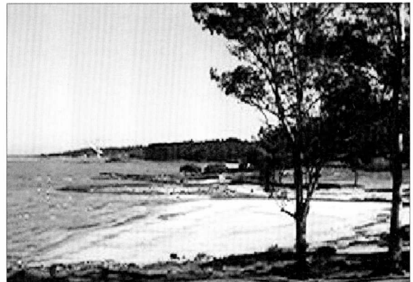
Figuras 7 y 8. Paisajes de la Costa Oeste Montevideo