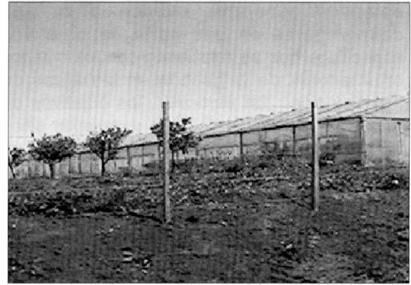
Figuras 1 y 2. Paisajes productivos de Montevideo rural