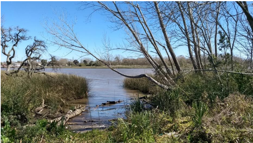
Figura 2: Humedal en la Isla Paulino.