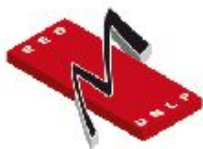
Red de Museos