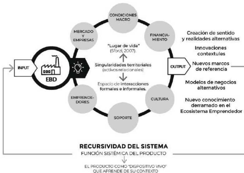
Figura 2. Funcionamiento general del Ecosistema emprendedor.

Unos de los cambios más significativos detectados en las prácticas emprendedoras de los últimos tiempos, tiene que ver con que las iniciativas principalmente se accionan a partir de los recursos y potencialidades personales que el emprendedor trae. En consecuencia, a diferencia del paradigma tradicional de la ‘oportunidad latente’, las oportunidades son interpretadas de manera singular y están condicionadas por el background, la cultura profesional y la extensión de sus relaciones interpersonales.