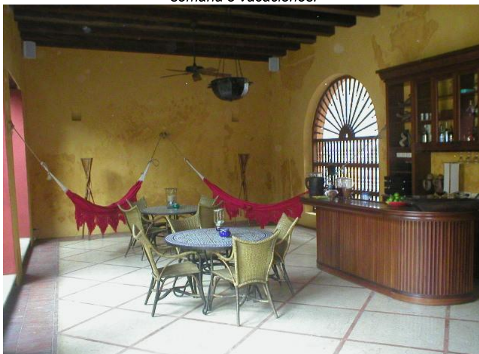
Fig. 6. Cartagena, Colombia. Vivienda colonial restaurada y usada como casa de fin de semana o vacaciones.

El fenómeno de la gentrificación , anglicismo derivado de la palabra gentrification , y ésta de gentry (personas de clase alta aunque no pertenecientes a la nobleza), significa el reemplazo de población típica de un determinado barrio o área urbana por otra de mayores recursos económicos o de posición social más encumbrada. Lo cierto es que este proceso se verifica por igual en centros históricos de todo el mundo, aunque con mayor recurrencia en países menos favorecidos económicamente, donde se dan los procesos descritos en que los habitantes prefieren, a veces por voluntad propia, emigrar a otros barrios y vender sus propiedades ( Fig. 6 ). El problema que ocasiona este proceso radica fundamentalmente en que los edificios son adquiridos por personas físicas o jurídicas que, por lo general, los afectan a usos diferentes del original. Es así que resulta frecuente encontrar antiguas residencias convertidas en hoteles, restaurantes, comercios o bien, aun manteniendo el uso residencial, son dedicadas a vivienda secundaria y ocupadas durante períodos breves a lo largo del año. Esto implica que el barrio pierde paulatinamente su población, lo que significa, a la vez, como expusimos más arriba, poner en crisis algunos aspectos de su autenticidad. En este caso, aunque los componentes materiales de los edificios puedan encontrarse en buen estado de conservación, aun mejorados respecto a su situación anterior, habría una pérdida de la autenticidad de funciones y vocaciones.