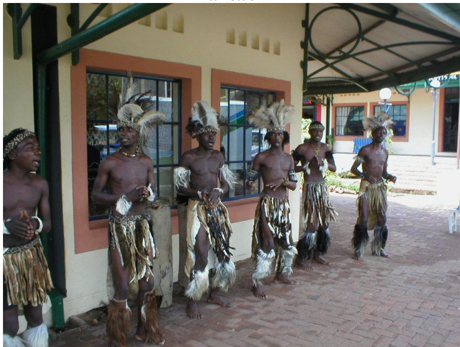
Fig. 5. Victoria Falls, Zimbabwe, residentes ejecutando danzas tradicionales para los turistas.

El problema que se origina es que de este modo la comunidad residente, o algunos de sus integrantes, se ponen al servicio de las expectativas del visitante; esto implica otra forma de amenaza contra la autenticidad, en este caso referida a modos de vida, hábitos, conductas, etc.