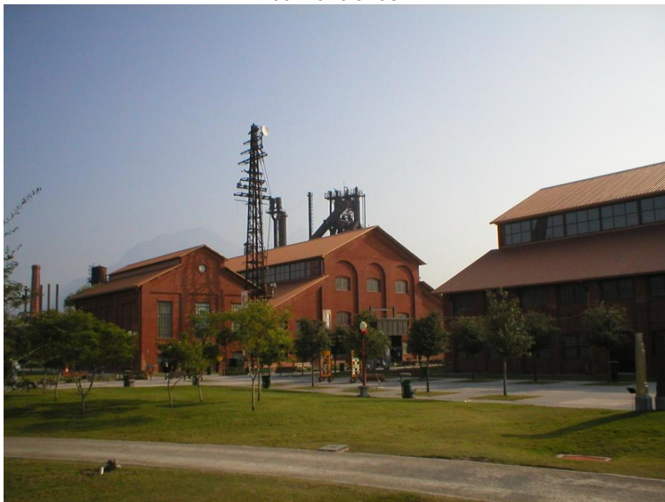
Fig. 2: Complejo Fundidora de Monterrey, México, convertido en centro de congresos y convenciones.

Más allá de los efectos positivos del turismo como actividad y de una posible relación armónica entre la conservación del patrimonio y el desarrollo del turismo, decíamos que, de no mediar una adecuada planificación, pueden existir también efectos negativos, con lo cual el turismo pasa a convertirse en una amenaza. En este apartado veremos algunos aspectos que pueden ser considerados negativos.