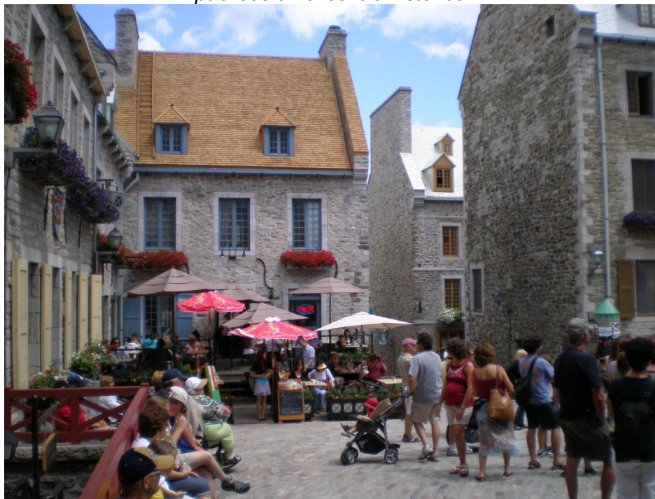
Fig. 4: Québec, Canadá, impacto del turismo en los usos de edificios y espacios públicos en el centro histórico.