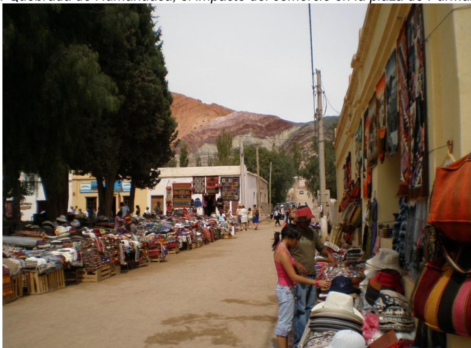
Fig. 1: Quebrada de Humahuaca, el impacto del comercio en la plaza de Purmamarca.