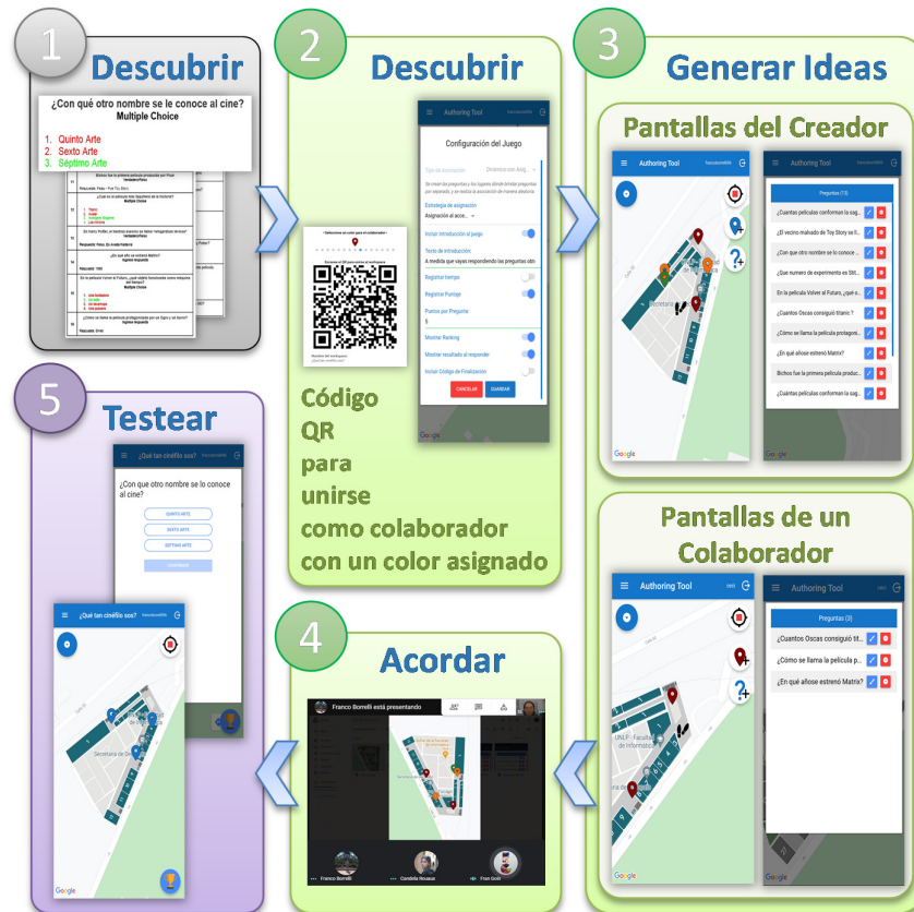
Fig. 4. Actividades de co-diseño distribuido llevadas a cabo en la experiencia donde se usó la herramienta de autor como recurso central.

En la Fig. 4 se pueden apreciar gráficamente las distintas actividades realizadas enmarcadas en el framework conceptual definido en la Fig. 2. La actividad 1 fue realizada por el facilitador para agilizar algunos pasos que no eran el foco de interés a abordar en esta experiencia. Las actividades 2 a 5 se llevaron a cabo de manera sincrónica una seguida de la otra; este co-diseño distribuido tuvo una duración total de una hora y media.