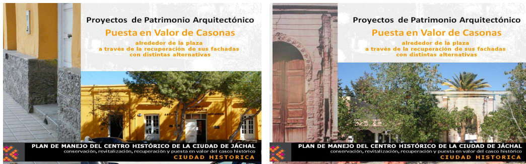
Figura 3: Proyecto Puesta en valor de casonas alrededor de la Plaza Principal

La propuesta son imagenes para materializar una fachada que fue demolida. La representacion contempla una estructura soporte, color textura luz. Son instalaciones culturales, evocadoras de una arquitectura en su mayoría de tierra en donde las nuevas tecnologias ponen en valor la memoria arquitectónica de la ciudad y sea capaz de transmitir una historia de vida la intangibilidad de su espiritu.