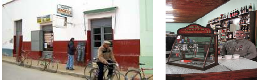
Figura 4: Proyecto Puesta en valor. Revitalización Bar Garcés

Funciona como centro de información del turismo ya que en cada mesa, y del tamaño de las mismas, debajo de los vidrios hay afiches con fotos y explicaciones del patrimonio natural y cultural jachallero.