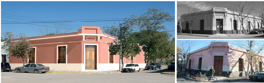
Figura 5: Proyecto Construcción y terminación edificio Biblioteca D. F. Sarmiento

Reconstrucción y simplificación de elementos constructivos y detalles en la fachada como fue concebida originalmente.