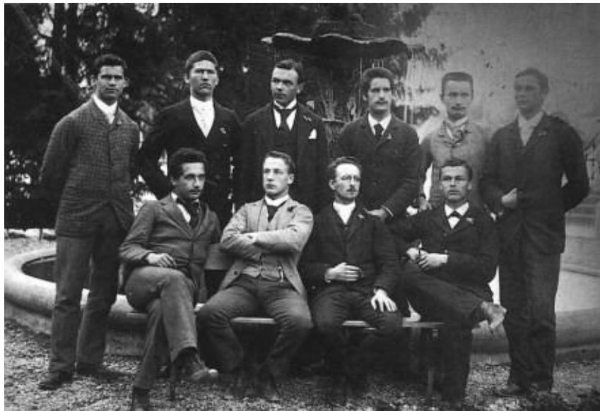
Figura 4. Einstein junto a sus compañeros de clase en el ETH.