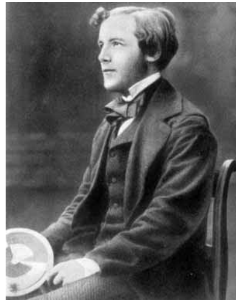
Figura 1. James Clerk Maxwell

La unidad fundamental de la electricidad es el electrón, descubierto experimentalmente hace poco más de un siglo, en 1898 por J. J. Thomson; esta partícula elemental es un constituyente básico del átomo y posee una carga eléctrica indivisible. Las cargas eléctricas pueden estar en reposo o en movimiento. Por ejemplo en un conductor metálico hay electrones libres y es el movimiento de estas cargas bajo la influencia de un campo eléctrico lo que produce las corrientes eléctricas. Magnetos como el hierro, níquel, cobalto, entre otros, son fuentes del campo magnético. Imanes con polos opuestos se atraen y se repelen si tienen polos iguales.