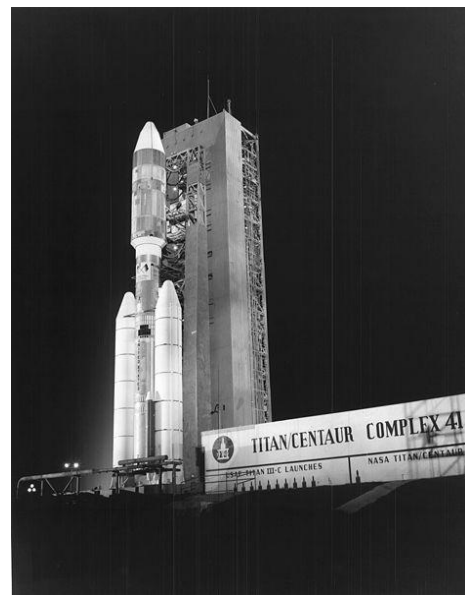
gura 6. Sonda Helios A en la cima del cohete Titan IIIE Centauro.

La verificación del fenómeno de ‘dilatación temporal’ implica la observación y medición de objetos con velocidades cercanas a la de la luz. Como se ha mencionado, se está aún lejos de poder construir vehículos que se muevan a esas velocidades; el universo, sin embargo, es el mejor laboratorio para testear muchas teorías de la física y en particular ha posibilitado verificar el fenómeno de dilatación temporal mediante la observación de partículas sub-atómicas relativistas. La existencia de dichas partículas se conoce desde la década de 1910 cuando en una serie de vuelos en globo, Victor Hess (1883-1964) descubrió que la Tierra se encuentra inmersa en un mar de radiación cósmica. Esta radiación está mayormente formada por partículas llamadas muones creadas por la interacción de rayos cósmicos (partículas muy energéticas provenientes del espacio) con los átomos de la alta atmósfera. En el sistema de referencia propio del muon, sin embargo, sólo viven alrededor de dos microsegundos, tiempo insuficiente para poder estar siquiera a kilómetros de nuestras cabezas. La razón de que muones lleguen a la superficie del planeta es la dilatación del tiempo predicha por la relatividad especial: el tiempo de vida de los muones aumenta cuando es medido desde un sistema de referencia terrestre.