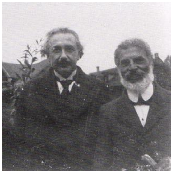
Figura 5. Einstein y su amigo Michele Besso.

El núcleo de la formulación de la nueva teoría está contenido en dos postulados. Los dos postulados de la teoría son: