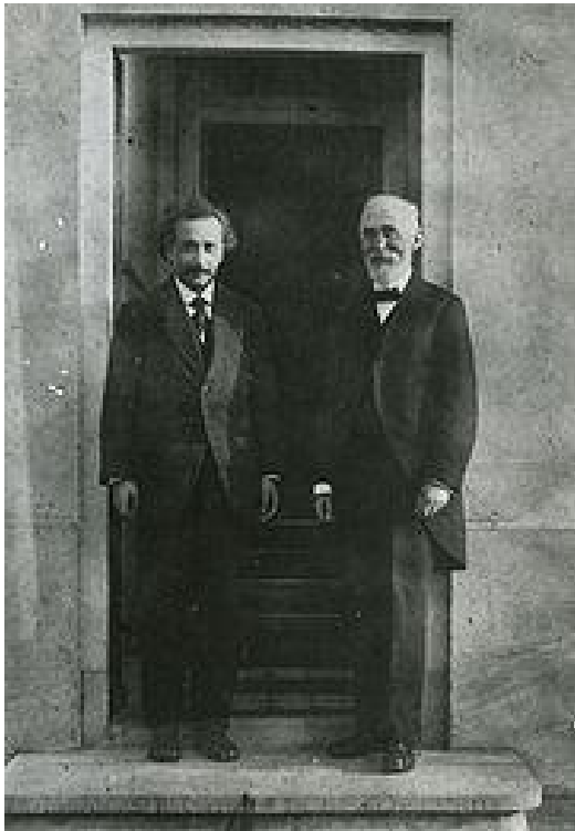
Figura 3. Einstein y Lorentz fotografiados por Ehrenfest en la puerta de su casa en Leiden en 1921.

Sólo un año antes de la aparición de la Teoría Especial de la Relatividad, en el International Congress of Arts and Science en St. Louis, Poincarè cuestiona la existencia del éter, objeta el concepto de velocidad absoluta y simultaneidad e intuye que acaso una nueva dinámica debe construirse donde la velocidad de la luz es el límite máximo para la velocidad de los cuerpos. Poincarè fue un visionario y el último “universalista” (después de Gauss) capaz de entender y contribuir en todos los ámbitos de la disciplina matemática.