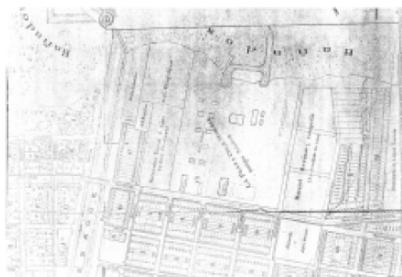
Figura 2: 1916, plano no oficial, c. 1916

En 1895, los saladeros San Juan y San Luis pasan a propiedad, por terceras partes, de la Sociedad Saturnino Unzué (que compro la parte de Berisso) y los herederos de Solari y Vignale, terminando así la vinculación de Juan Berisso con la industria a la que le diera origen. Cinco años después, la firma Unzué e hijos vende el predio de los saladeros a La Plata Cold Storage S.A. En 1915, (en el contexto de la guerra mundial de 1914) se estableció otro frigorífico "El Armour". Un año después La Plata Cold Storage pasó a llamarse "Swift". (Figura 2)