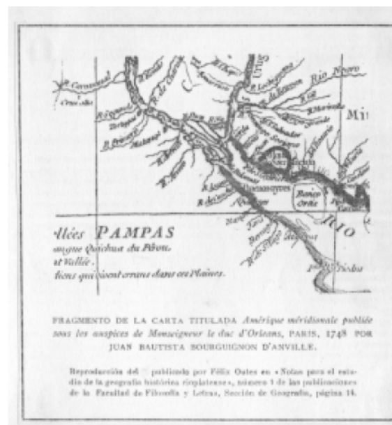
Figura 1: 1748. Fragmento de la Carta de Juan Bautista Bourguignon A Anville ( Lara y Barragán)

etapas, desde hace 14.000 años hasta 4.000 años atrás, cuando el Río de la Plata comienza a avanzar. (Figura 1)