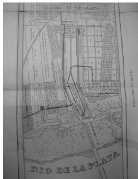
Figura 4: Archivo de Geodesia, 1916 Gran Dock con la traza del pueblo.