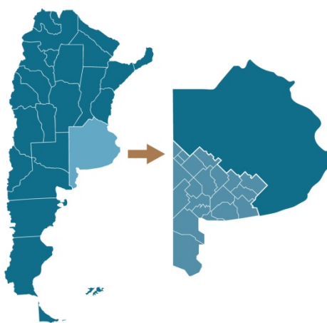
Fig. 1. Localización del área de estudio (Sudoeste Bonaerense)

El sudoeste bonaerense (SOB, Fig.1), que tiene como principal actividad económica la producción agropecuaria, genera permanente estos residuos peligrosos, siendo esta una problemática que sólo se ha tratado de manera aislada y poco eficiente en los distintos municipios.