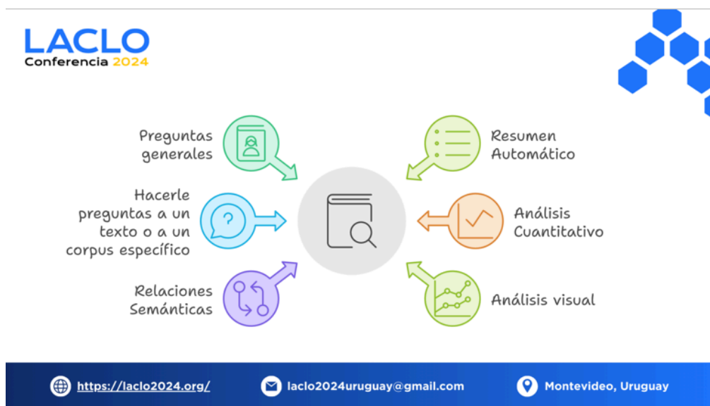
Figura 5: Posibles interacciones complementarias a la lectura cercana con textos.

6 muestra un slide utilizado durante el taller en el que se indica, considerando la secuencia de diseño, la herramienta a utilizar en un momento dado.