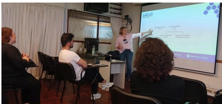
Figura 4: Facilitadora durante la introducción del taller.

La sala en la que se desarrolló el taller contaba con dos pizarras, sobre una de las cuales se proyectaban los slides preparados para el taller y en la otra era posible sumar anotaciones y explicaciones a partir de la interacción con los participantes. La conectividad a internet era adecuada y tanto la facilitadora del taller como los participantes pudieron conectarse vía WIFI de manera eficiente. Esto permitió que tanto la introducción general como la de las herramientas se pudiera llevar a cabo de manera satisfactoria, la Figura 4 muestra una imagen de la facilitadora durante la introducción del taller.