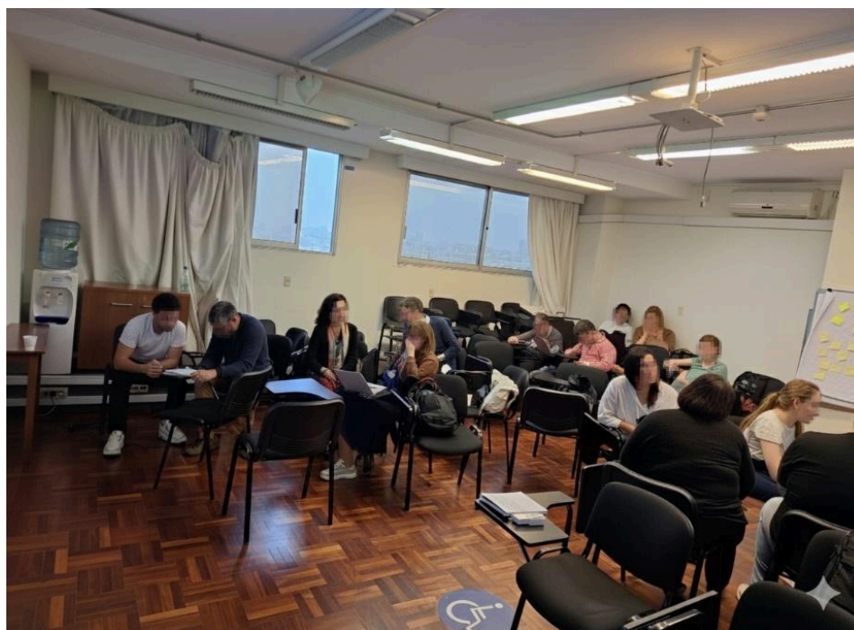
Figura 7: Participantes diseñando e implementando actividades a partir de la secuencia de pasos .

Durante el tiempo destinado a que los participantes realizarán el diseño e implementación de las actividades usando la secuencia y las herramientas y métodos presentados, se generaron consultas grupales, individuales y generales, lo que enriqueció el taller.