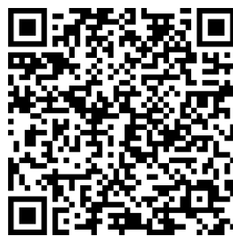
Figura 3: Qr para acceder a la encuesta

Se diseñó una encuesta estructurada (Lliteras, 2025) que se dejó disponible online en Google y se creó un código QR para que los estudiantes pudiesen acceder a ella y completarla voluntariamente al finalizar el encuentro.