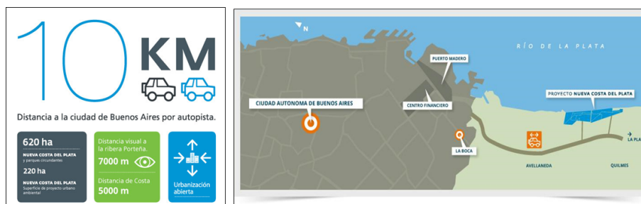
Figura N°2 Estrategias de comercialización: ubicación estratégica, cercanía a los grandes centros urbanos y distancia visual a la ribera Proyecto Nueva Costa del Plata (página web)

En total, el megaproyecto abarca 102 hectáreas en el partido de Avellaneda y 128 en el partido de Quilmes, para construir viviendas, hoteles de lujo y comercios, en una franja costera de casi 3 kilómetros, que conllevarían las diversas modificaciones antes presentadas para volverla urbanizable. Su ubicación no es casualidad, ya que lo que impulsó a la recuperación de esos terrenos fue la cercanía a Ciudad Autónoma de Buenos Aires, a La Plata (ciudad capital de la provincia), y la cercanía al río, y por lo tanto de la naturaleza (figura N°2).