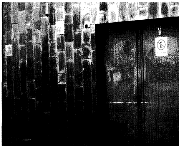
Figura 4. Roca cortada en revestimiento exterior