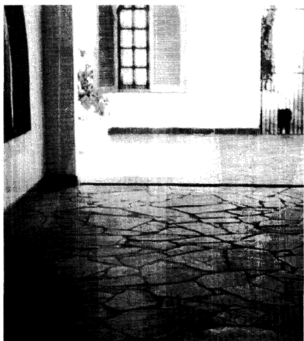
Figura 3. Roca de forma irregular, interior