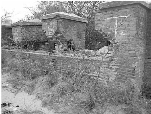
Figura 4 Almenas inclinadas (falta apoyo)

En la Figura 3 se puede ver el estado de abandono en que se encontraban el muro de aguas abajo y las almenas de la derivación al canal San Martín, el saqueo de piezas metálicas y la inclinación de las almenas del medio como consecuencia de la disminución de la sección de apoyo, cosa que se aprecia en Figura 4. También las almenas de las compuertas descargadoras se encontraban en estado ruinoso; a la almena del medio le faltaba la parte superior, se supone que por saqueo (Figura 5).