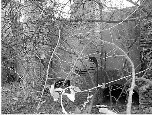
Figura 2 Boca toma desde aguas arriba