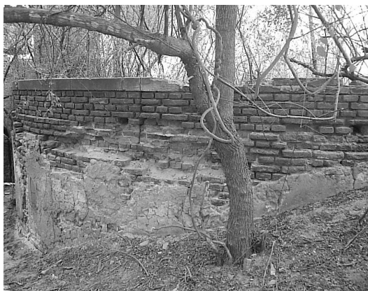
Figura 6 Muro de guardia deteriorado