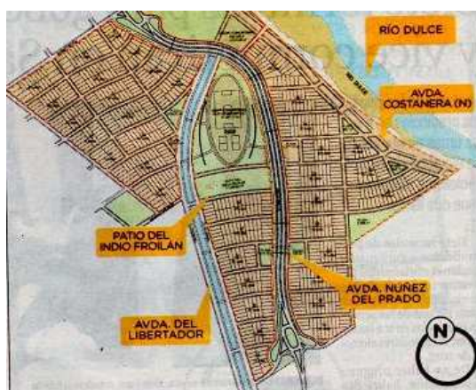
Figura 7 Planta de las obras en ejecución

La avenida Costanera Norte es una prolongación de la costanera existente y según el trazado al que tuvimos acceso, pasa por la zona comprendida entre la boca toma y la salida del sifón que actualmente alimenta al canal San Martín, bordea el Barrio Aeropuerto y continúa hasta empalmar con la ruta provincial 208, punto en el cual está prevista un rotonda que permitirá conectarse con la Avenida Madre de Ciudades y la antigua traza de la Ruta Nacional N° 9, hacia el dique Los Quiroga (Figura 7).