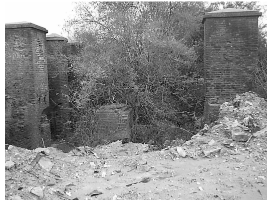
Figura 5 Almenas compuertas descargadoras

El paso sobre la alcantarilla se encontraba en estado de abandono y faltaban partes de los muretes superiores del ala aguas arriba (Figura 2). El estado ruinoso del muro de guardia de la boca toma aguas arriba se aprecia en Figura 6. De los sistemas de compuertas no habían quedado vestigios, solo las guías sobre las que se deslizaban (ver Figura 2).