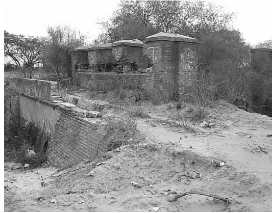
Figura 3 Boca toma desde aguas abajo

En la Figura 3 se puede ver el estado de abandono en que se encontraban el muro de aguas abajo y las almenas de la derivación al canal San Martín, el saqueo de piezas metálicas y la inclinación de las almenas del medio como consecuencia de la disminución de la sección de apoyo, cosa que se aprecia en Figura 4. También las almenas de las compuertas descargadoras se encontraban en estado ruinoso; a la almena del medio le faltaba la parte superior, se supone que por saqueo (Figura 5).