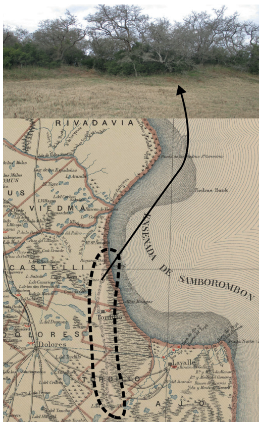
Figura 5. Mapa indicando el rosario de médanos de arena (De Mot, 1880), y médano remanente con bosque de tala en el kilómetro 195 de la Ruta 11.

con registros en Paraná (Entre Ríos) y en la Ciudad Autónoma de Buenos Aires a principios del siglo XX (Acosta y Guerrero, 2021).