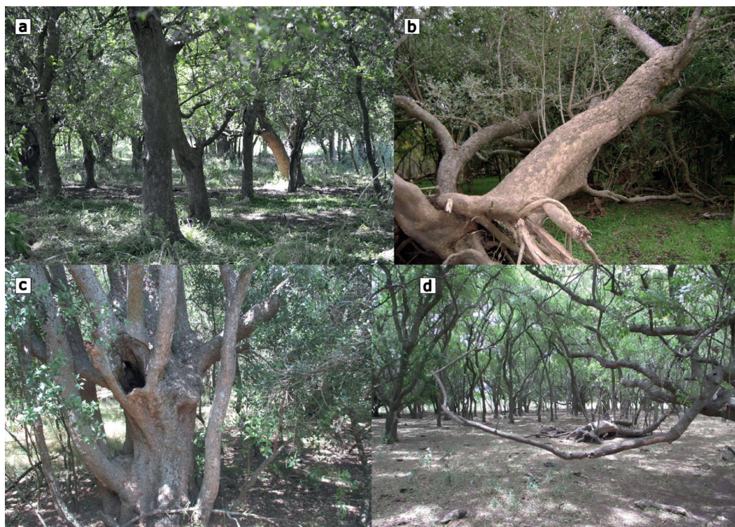
Figura 4- Talares en núcleos aislados sobre o por detrás de la paleocosta holocena. A, Villa Garibaldi-Arroyo El Pescado, sobre paleocosta, La Plata; B, Laguna Salada de Monasterio, sobre duna loessica, partido de Chascomús; C, Puente de Pascua, sobre paleocosta, partido de Castelli; D, La Viruta, Ruta 20, en la planicie, partido de Chascomús.

puede proponer otra posibilidad acerca de la expansión y retracción de los bosques del Espinal, alternativa a la explicación dada por Frenguelli (1941). Se propone que el tala pudo haber sido un componente de la planicie pampeana desde el inicio del Holoceno, desde donde se pudo haber expandido en los períodos favorables de clima hacia el este y el norte. Los talares de San Miguel del Monte y Navarro, mencionados por Parodi (1940a), y otros menos conocidos como los de los alrededores de Chascomús (Figura 4b, 4d), muestran que estos árboles pueden haber crecido en contextos geográficos particulares dentro de la planicie. Los talares, previo a la aparición de los cordones de playa y dunas