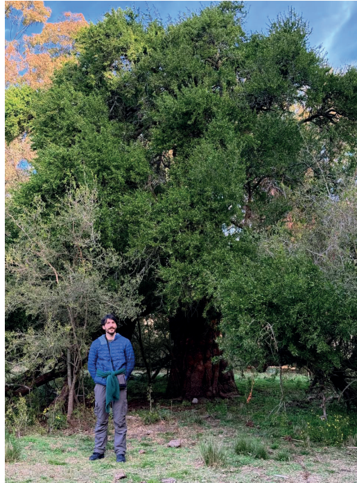
Figura 2- Ejemplar de gran porte de Schinus longifolius en las cercanías de Claromecó.

En las proximidades del arroyo Claromecó, a unos 8 km de la localidad homónima, se encuentra el viejo casco de la estancia Bellocq, en el cual se asienta un bosquecillo de Schinus longifolius con presencia de renovales y al menos cuatro ejemplares de gran porte: dos con DAP de aproximadamente 0,78 m, uno de 1,10 m y otro de 1,72 m (Obs. pers. F. R.). La distribución geográfica de esta especie abarca el centro-este de Argentina, Uruguay, sur de Brasil y este de Paraguay. En Buenos Aires se encuentra en los talares del norte hasta Bahía Samborombón y en el caldenal del suroeste hasta el Sistema Serrano de Ventania (Guerrero, 2022). Por el este hay escasos registros en la costa Atlántica que parecen evidenciar una expansión hacia el sur como la que ocurre con el tala (e.g., dunas entre Costa Chica y Santa Teresita, partido de La Costa, y cerca del Monumento a José Luis Cabezas, partido de General Madariaga; Obs. pers. E. L. G.). En el centro de la provincia, en Cacharí, hay zonas donde este árbol crece en alambrados como los talas, lo cual también hace sospechar de una expansión reciente a pesar de lo aislada de esta última localidad con respecto a otras poblaciones de la especie. A diferencia de los ejemplares regis-