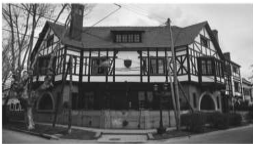
Rowing Club Argentino (1922)