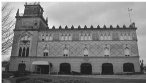
Club Canottieri Italiani (1910)