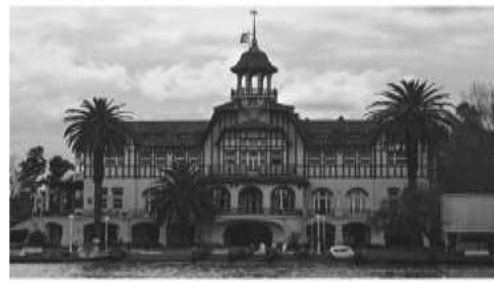
Club de Regatas La Marina (1927)