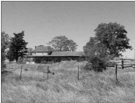
Figura 3 - Antigua estación de tren