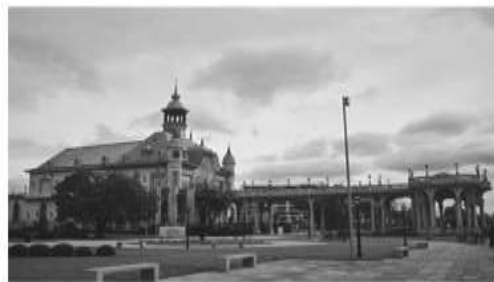
Ex Tigre Club (1910)