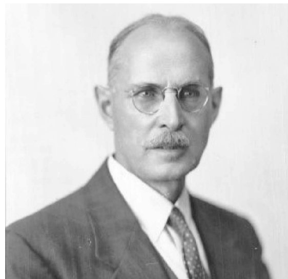
Figura 1: Fréderick G. Todd

Todd realizó informes en los que fundamenta la necesidad de planificar los crecimientos urbanos y también volvió a instalar, como precedentemente lo había hecho Olmsted, la importancia del sistema de parques. De acuerdo a su visión éste comprende el gran parque natural o las reservas, los parques suburbanos, los bulevares, los caminos parques, los parques lineales a lo largo de los cursos de agua, los parques urbanos y las plazas. Fue un activo promotor de los parques lineales y las reservas rurales destinadas a satisfacer las necesidades de las pobla-