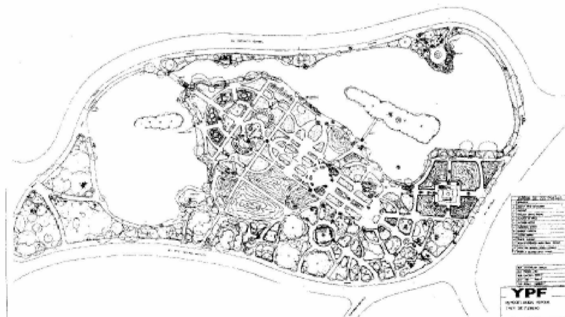
Figura 6: Plano del Rosedal de Palermo

Los precursores como Todd y Carrasco partieron de los conocimientos y prácticas adquiridas o provenientes de Europa y Estados Unidos, enseñanzas que debieron aplicar a realidades diferentes creando nuevas respuestas que se adaptaran a exigencias locales y culturales. Ambos consideraban a la arquitectura del paisaje indisolublemente unida al planeamiento urbano y regional; aspecto sobre el que pusieron especial énfasis en sus artículos y propuestas. También, coincide en ellos su preocupación por el rescate de la flora nativa y una intensa actividad en la promoción de la profesión. Podría señalarse que, a pesar de la distancia geográfica que separa los dos extremos del continente americano, estos paisajistas intentaron dar respuestas locales a preocupaciones comunes al campo del diseño del paisaje, inquietudes que provenían en gran parte de las necesidades de afianzamiento y desarrollo de estos jóvenes países.