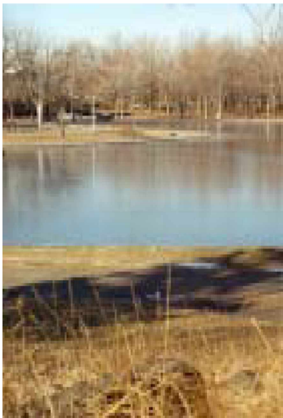
Figura 3: Vista actual del Lago de los castores