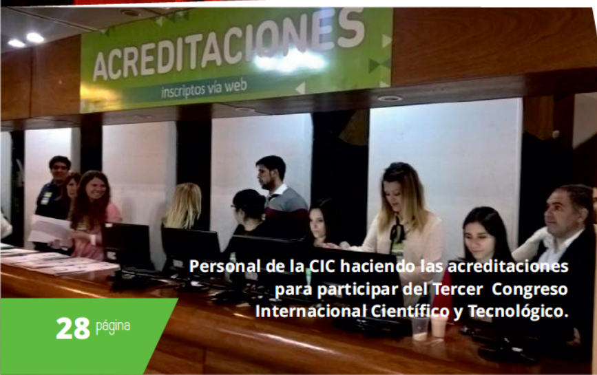
Personal de la CIC haciendo las acreditaciones para participar del Tercer Congreso Internacional Científico y Tecnológico.