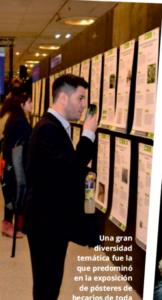
Una gran diversidad temática fue la que predominó en la exposición de pósters de becarios de toda la Provincia.