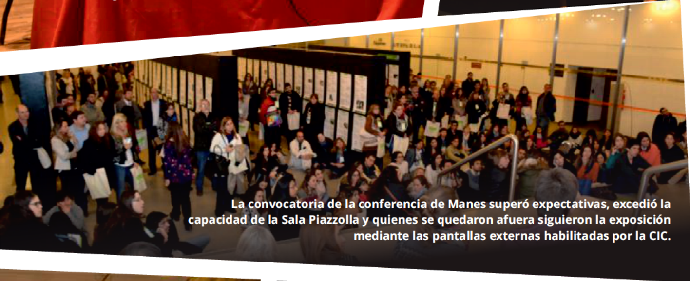
La convocatoria de la conferencia de Manes superó expectativas, excedió la capacidad de la Sala Piazzolla y quienes se quedaron afuera siguieron la exposición mediante las pantallas externas habilitadas por la CIC.