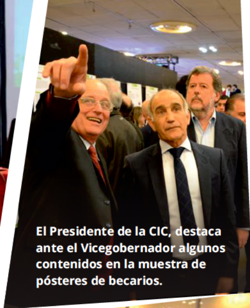
El Presidente de la CIC, destaca ante el Vicegobernador algunos contenidos en la muestra de pósters de becarios.