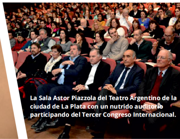
La Sala Astor Piazzola del Teatro Argentino de la ciudad de La Plata con un nutrido auditorio participando del Tercer Congreso Internacional.