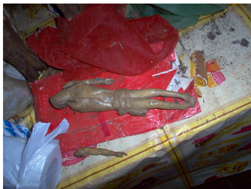
Fotografia 2. Senhor Morto, do qual restou somente o tronco intacto (Inventário N° RS/91-0001-0053). Residência da família Chagas, na época "acervo particular".