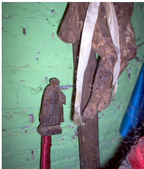
Fotografia 3. São Pedro (Inventário N° RS/91-0001-0052). Esta imagem não existe mais, foi totalmente destruída. Pela imagem é possível denotar o local onde estavam armazenadas as imagens na época.