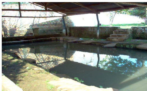
Fotografia 4. Fonte de São Pedro.