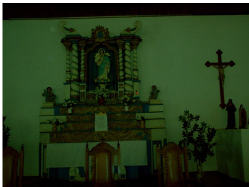
Fotografia 1. Retábulo frontal (mesa). Material/escultura, policromia. Proprietário: Paróquia Imaculada Conceição, bairro do passo. São Borja (RS). Fonte: INVENTÁRIO DA IMAGINÁRIA MISSIONEIRA – DEZ/92. Foto de Fernando Rodrigues