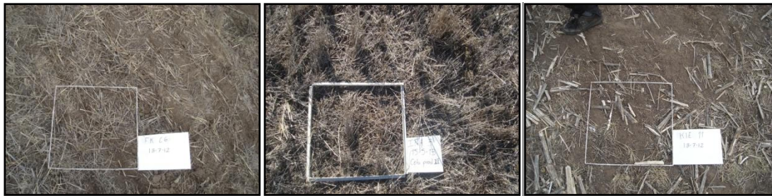
Figura 1. Residuos en superficie en diferentes sitios del sudoeste bonaerense bajo siembra directa.

Según Hobbs et al. (2008) y FAO (2012) la cobertura de suelo inferior a 30% no se considera como AC. Lal (2003) coincide con este valor y estableció que cualquier método de labranza que deje suficientes residuos de cultivos para cubrir al menos el 30% de la superficie del suelo después de la siembra, puede ser considerado AC. Asimismo, según Scopel et al. (1998) un 30% de cobertura del suelo sería el límite que permite una importante reducción de la pérdida de agua por escorrentía. Sin embargo, Duiker & Myers (2006) recomiendan una cobertura del suelo superior al 50% para la maximización de los beneficios de la SD. López et al. (2015) a partir del análisis de más de 120 lotes destinados a la siembra de cultivos invernales en el SOB observaron una gran variabilidad en la cantidad de residuos en superficie, con valores de 0 a 9614 kg ha -1 de rastrojos y grandes variaciones en la cobertura del suelo (Tabla 1).