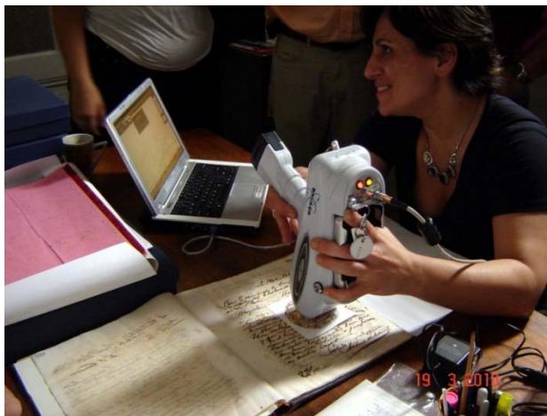
Figura 2. Procedimiento experimental, fluorescencia de rayos X.

pueden detectar aquellos elementos con número atómico mayor que 11 (Na). El equipo fue puesto sobre cada muestra interponiendo una ventana de acetato, como se muestra en la Figura 2.