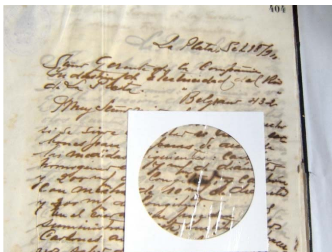
Figura 3. Muestra 2.