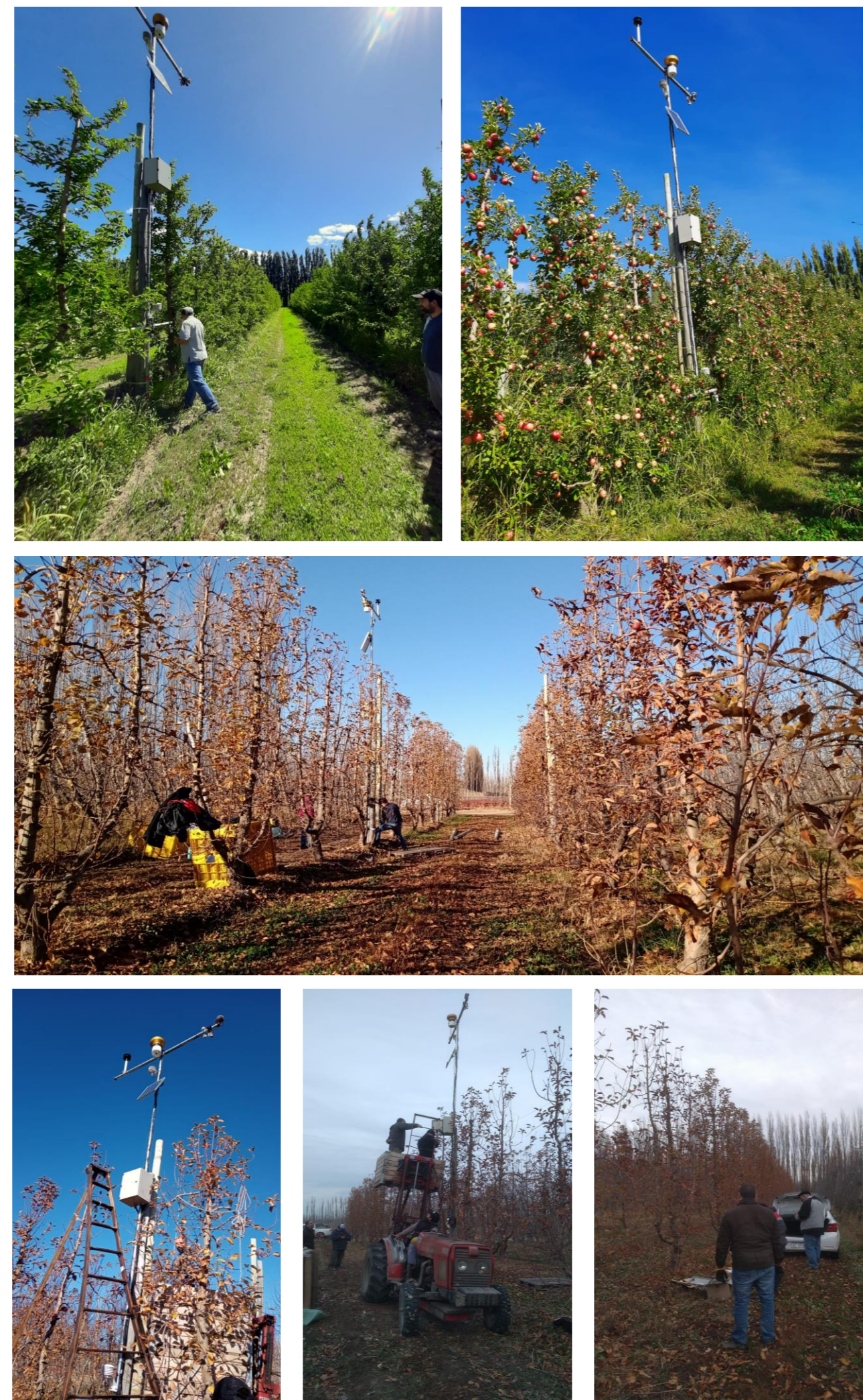
Figura 1. Esquema de la estación de monitoreo (izquierda) e imágenes de la etapa de instalación en la zona de manzanos (derecha).