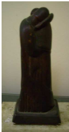
Fig. 19: Pareja