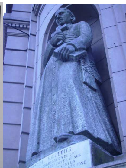
Fig. 3: San Miguel de Garicoits, 1952