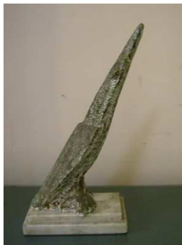
Fig. 9: Biguá (1938)

Aquí, el animal representado se define por la forma geométrica. Nombramos como ejemplo los pájaros estilizados (Figuras 9, 10 y 11).