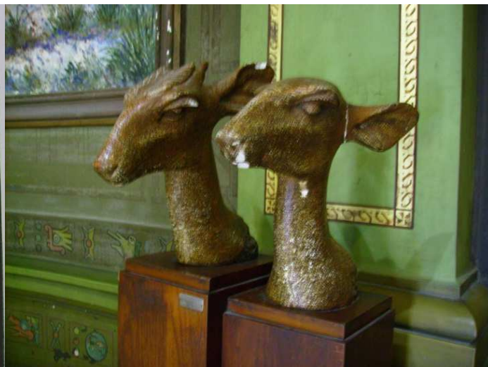
Fig. 6: Venados, 1945