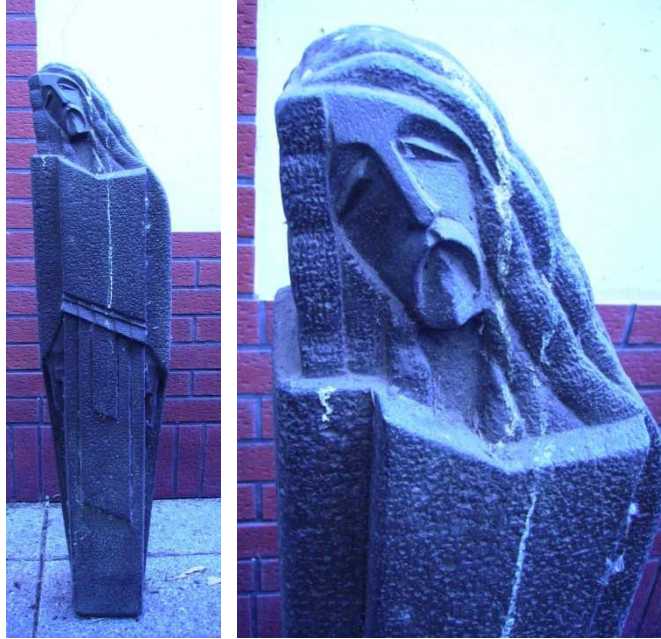
Fig. 17: Cristo (y detalle)

En menor proporción, trabaja sumando partes redondeadas en lugar de planos rectos.