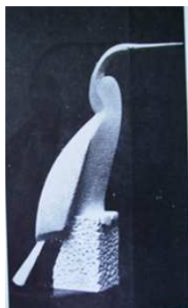
Fig. 10: Pato serpiente (1938)