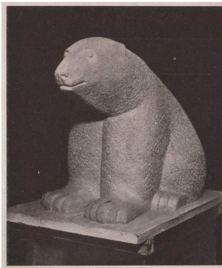
Fig. 1: Oso polar, 1934

Podríamos ejemplificar, ese primer momento con la obra “Oso Polar” (figura 1) (Salón Nacional de 1934). El segundo momento, de simplificación con “Hermanas” (figura 2) y el tercer momento, de grandes planos estructurales, con “San Miguel de Garicoits” (figura 3)