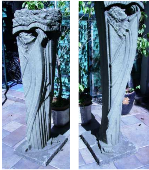
Fig. 21: Cariátide

geometría y la síntesis de las formas. En ambos momentos, realista y sintético, existen características comunes: el trabajo textural, rítmico y tendiente a lo decorativo y la simulación del material pétreo.