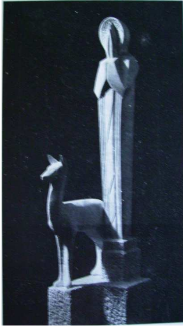
Fig.16: San Francisco con cervatillo, c.1937