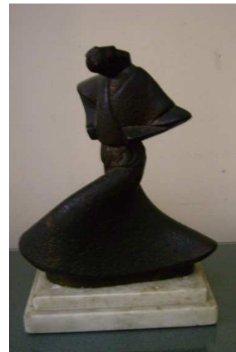
Fig.20: Danza, 1938

A veces la forma escultórica se piensa como formando parte de una arquitectura, los cuerpos prismáticos parecen surgir de pilastras.