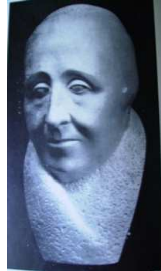
Fig. 12: Sarmiento, 1938 Fig. 13: J. V. González, 1942 Fig.14: Sra de H. Torroba, 1938