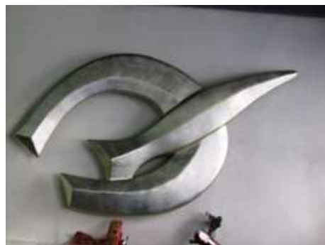
Fig. 11: Pájaro estilizado