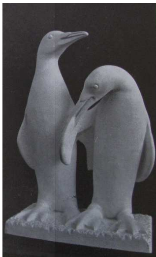
Fig.5: Pingüinos, 1938

Como ejemplos podemos nombrar los relieves en Museo Histórico de Ciencias Bernardino Rivadavia (Parque Centenario, Bs As) (Figura 4) y las cabezas de animales en Hall de Museo de Ciencias Naturales (Bosque, La Plata) (Figura 6).