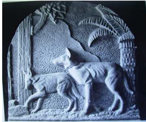
Fig.4: Aguará Guazú, 1937

Maldonado trabaja la composición a partir de la dualidad, generando la tensión entre el dinamismo del par contra la quietud de la simetría.