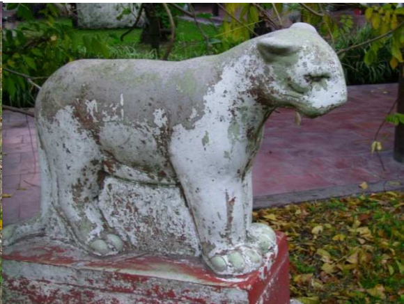
Fig. 8: Puma, 1956