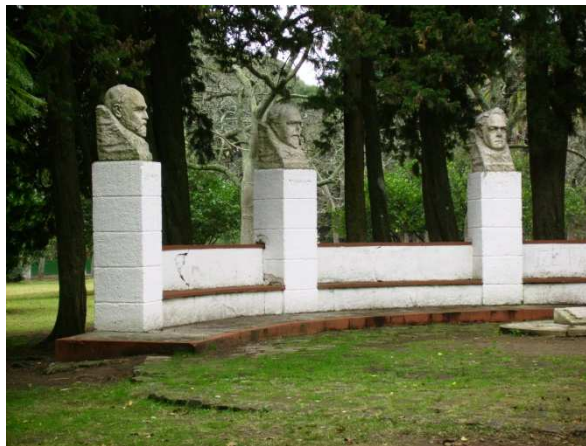
Fig. 15: Hemiciclo de los Cinco Sabios, 1942