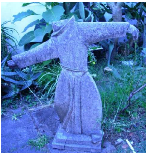
Fig. 18: Fraile

En menor proporción, trabaja sumando partes redondeadas en lugar de planos rectos.