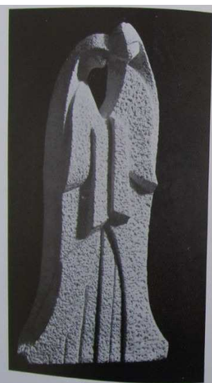
Fig. 2: Hermanas, 1937