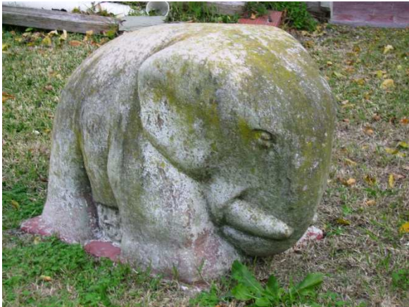
Fig. 7: Elefante, 1956

La idea de bloque se refuerza con el proceso de creación de moldes en dos partes, lo cual simplifica la forma.