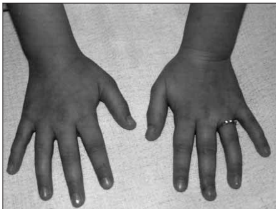
Figura 2. Pápulas de Gottron.

Las principales anomalías patológicas se localizan en los vasos sanguíneos del tejido conectivo de piel, intestino, músculo, tejido adiposo y nervios