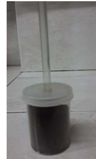
Bandeja con la PT utilizada durante el secado con convección forzada. Frascos para molienda del producto deshidratado.