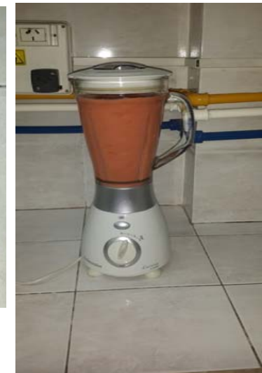
Partes no comestibles del tomate removida, trozos de tomates acondicionados y etapa de molienda homogeneización.