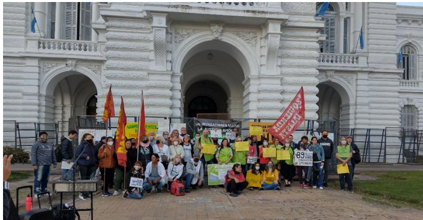
Fig. N°4: Marcha conmemorando el noveno aniversario de la inundación de abril de 2013

A pesar de los importantes estudios realizados por especialistas pertenecientes a la UNLP que alertaban del peligro y de la inundación de enero de 2002 o la ocurrida en febrero de 2008, que preanunciaban el trágico desenlace, la desidia, la inoperancia y la corrupción de los sucesivos gobiernos nacionales provinciales y municipales terminó causando la más terrible catástrofe en nuestra ciudad. (...) Lo que pudimos observar al atravesar esa nefasta noche y los días posteriores fue cómo el Estado estuvo ausente, mientras que fuimos los vecinos quienes nos ayudamos entre nosotros y acompañamos como en tantas otras tragedias que nos tocó vivir (Fragmento del comunicado de las Asambleas, 2 de abril de 2022).