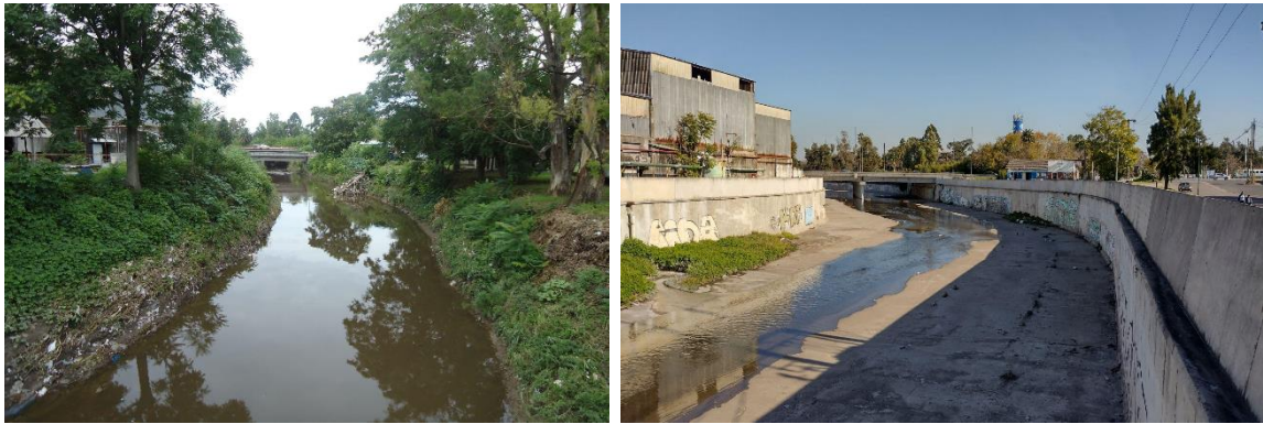
Fig. N°5: Comparación del tramo de 12 y 514 del Arroyo del Gato antes y después de la obra