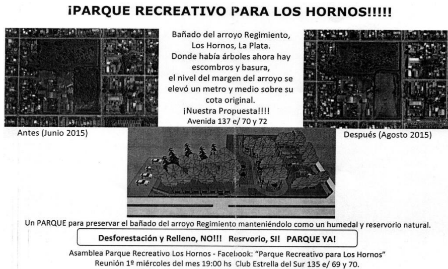
Fig. N°6: Campaña de difusión de la Asamblea Los Hornos