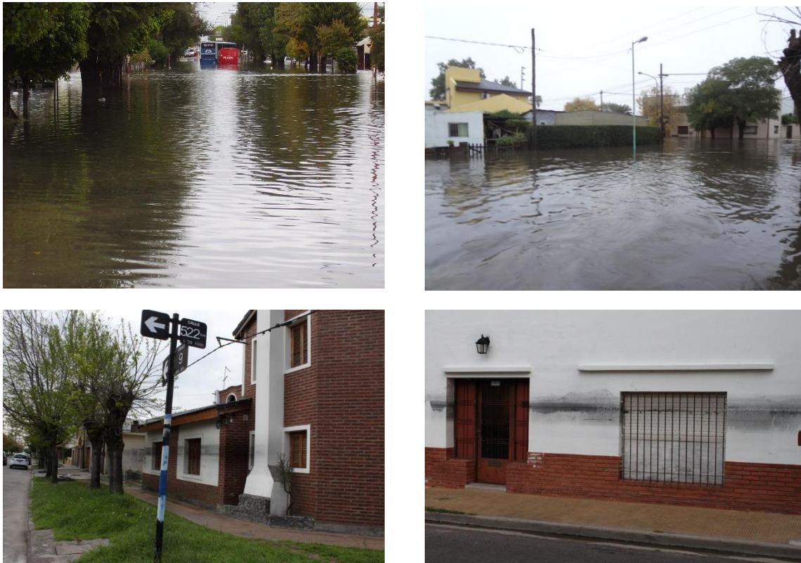
Fig. N°2: Zonas anegadas y marcas en las viviendas que muestran hasta dónde llegó el agua.