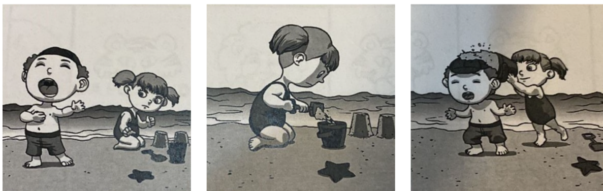
Figura 1: Prueba de escritura de textos. Viñetas.